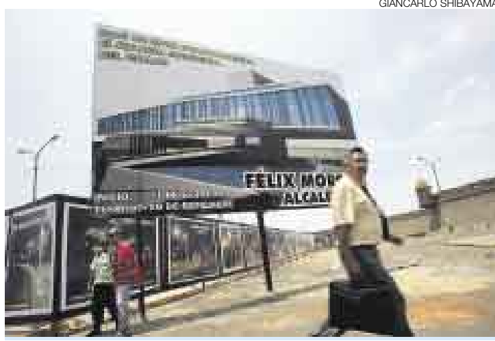
SEGUROS. El concejo da por hecho que obtendrá el permiso del INC.

Los vecinos temen que se altere el equilibrio arquitectónico