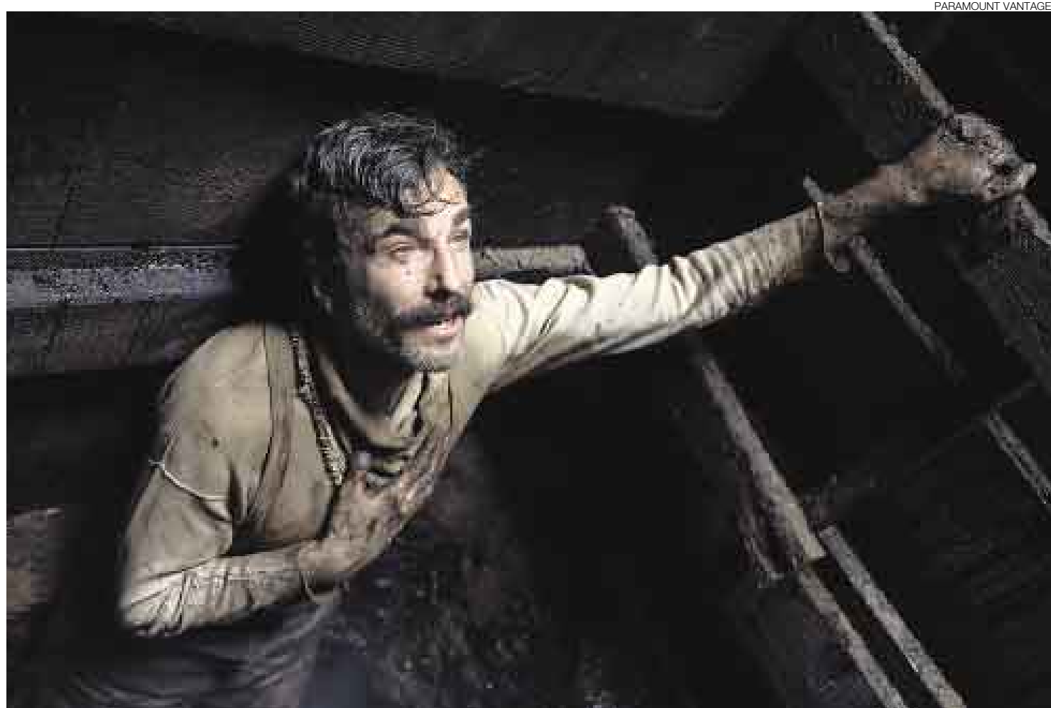
PLAINVIEW. Daniel Day-Lewis suma un nuevo personaje íntimamente ligado a la experiencia estadounidense con este filme.

No es necesariamente algo de lo que sea consciente. Debe haber una parte de mí que se siente intrigada, quizá como de alguien foráneo, por el descubrimiento