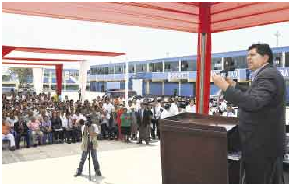
PROMESA POR CUMPLIR. El presidente Alan García estuvo ayer en Amazonas y La Libertad y anunció que en este año se destinarán 10 mil millones de soles para obras de inversión social en el país.

A aquellos funcionarios renuentes o temerosos de acelerar la ejecución de obras les dio un respiro, en el papel al menos: “Les