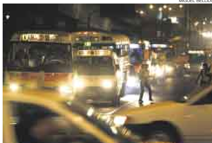
RIESGO. Los transeúntes exponen sus vidas en esta intersección.

La zona con más accidentes de tránsito en toda Lima, según el último estudio realizado por el Ministerio de Transportes y Comunicaciones, es el cruce de las avenidas Tomás Marsano y Caminos del Inca, en Surco. La Municipalidad de Lima, responsable del mantenimiento de esta vía, afirmó que no tiene presupuesto para arreglar los problemas de señalización y sincronización de los semáforos. [A14]