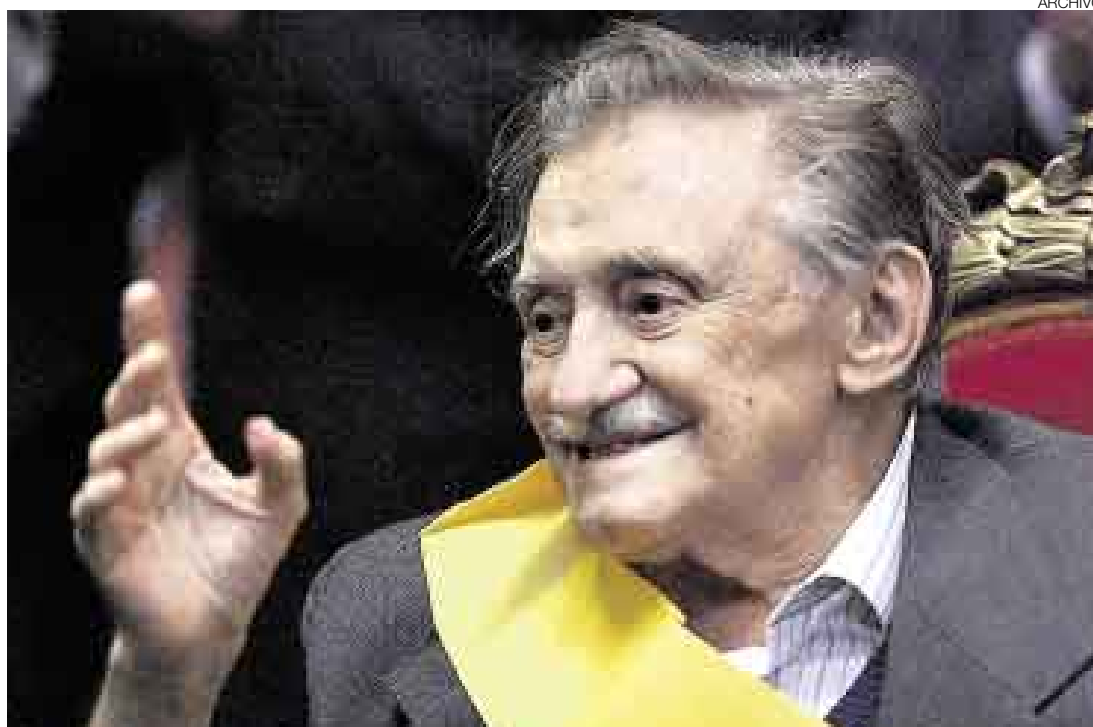
BIEN DE SALUD. El poeta libró durante un mes batalla contra la enfermedad. Su recuperación tranquilizó a los uruguayos.

Benedetti, de 87 años, quien reside alternativamente entre Montevideo y Madrid para evitar los fríos debido a sus problemas de asma, ingresó al centro médico, a causa de una deshidratación por una infección intestinal. “No requirió de