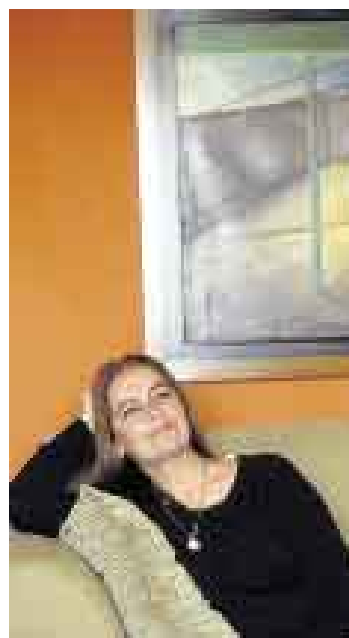
ROBLES. Poética de alta velocidad.

La posibilidad de leer “Alto Camino” se ve subrayada por la opción gráfica adoptada para el título del poemario de Robles, claramente escrito en la carátula, la portada, el copyright y la contratapa del siguiente modo: “HighWay”. El nexo con Altamar (mar adentro, alejado de la orilla, con riesgos de zozobrar) invita a captar Alto Camino como tierra adentro, como ruta alejada de lo rutinario, búsqueda con todos los riesgos y los tesoros de una aventura en pos de la plenitud vital, no importa si a solas, si en el desierto. El vínculo se ve reforzado porque en algunos poemas de “HighWay” emerge la imagen de la travesía marina: “Camino a Bakú”, “Cirugía extrema” (un poema que contiene