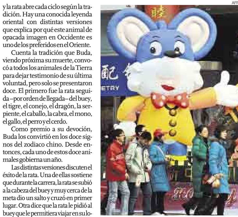
BIENVENIDO. Las figuras del roedor ya se exhiben en las calles chinas anunciando el inicio del nuevo año, el cual estará marcado por las esperadas Olimpiadas de Beijing.