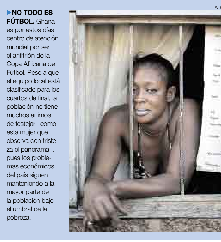
NO TODO ES FÚTBOL. Ghana es por estos días centro de atención mundial por ser el anfitrión de la Copa Africana de Fútbol. Pese a que el equipo local está clasificado para los cuartos de final, la población no tiene muchos ánimos de festejar —como esta mujer que observa con tristeza el panorama—, pues los problemas económicos del país siguen manteniendo a la mayor parte de la población bajo el umbral de la pobreza.