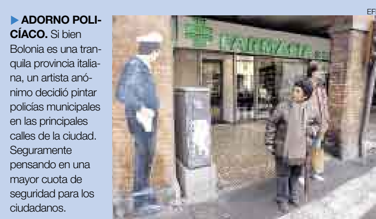
ADORNO POLICÍACO. Si bien Bolonia es una tranquila provincia italiana, un artista anónimo decidió pintar policías municipales en las principales calles de la ciudad. Seguramente pensando en una mayor cuota de seguridad para los ciudadanos.