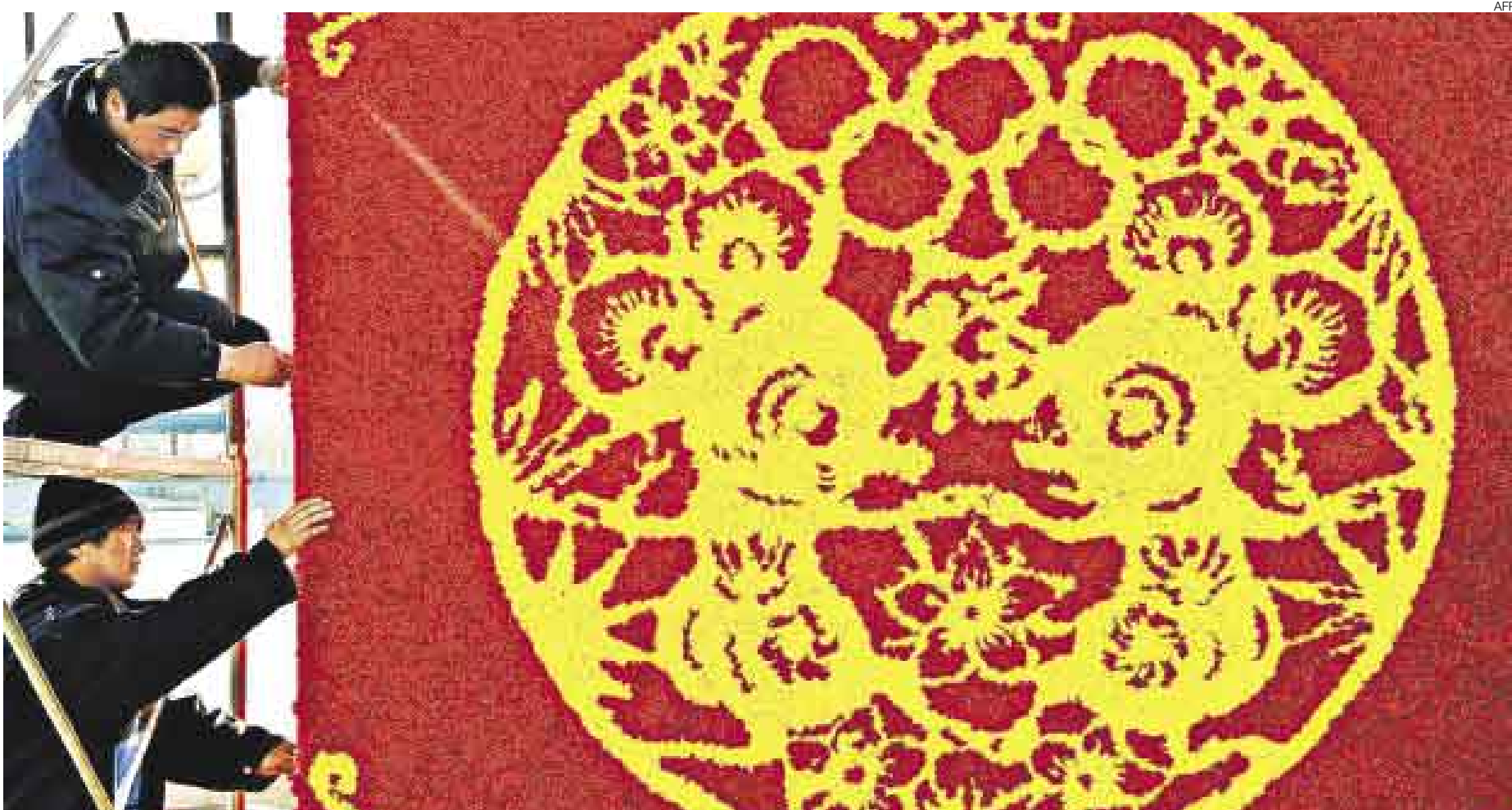
PREPARATIVOS. Un templo en Beijing se alista para recibir este 7 de febrero el inicio del Año de la Rata. En Oriente, este animal no tiene la connotación negativa que tiene en Occidente.