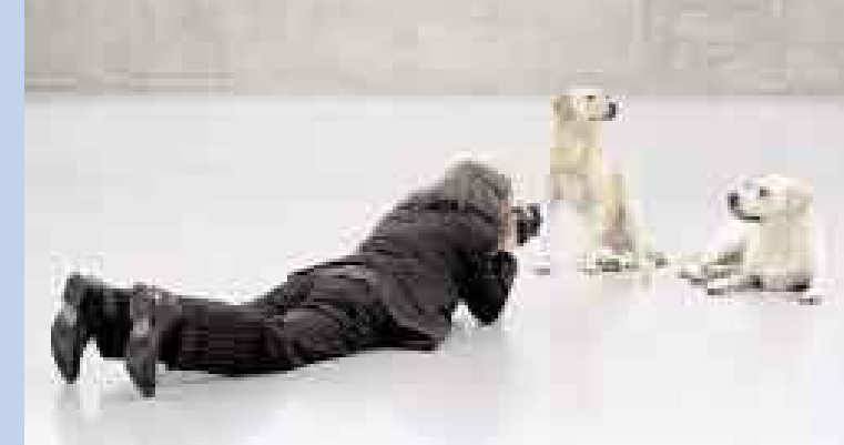
MODELOS PERROS. A estos canes no se les puede decir que tienen una vida de perros. Estos dos labradores no tienen nada que envidiar a las estrellas del modelaje, y posan como verdaderos profesionales en una sesión en Austria.