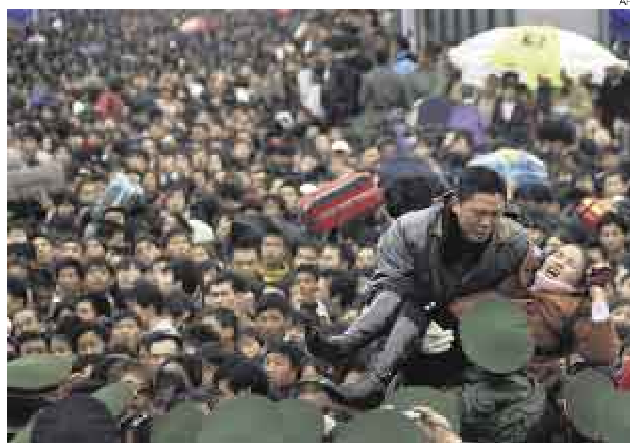
CAOS EN LA VISPERA. La nevada que se ha desatado en el país —la peor en medio siglo— ha impedido a millones de chinos regresar a sus pueblos para celebrar la llegada del Año de la Rata.