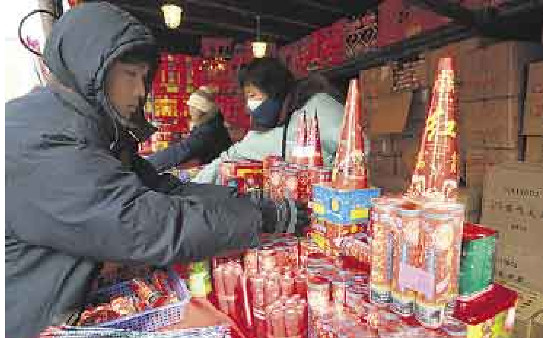
FIESTA. El Año Nuevo Chino es el feriado más importante del gigante asiático. Los vendedores ya ofrecen todo tipo de fuegos artificiales que se harán estallar durante la también llamada Fiesta de la Primavera.

RATA DE PRIMERA Mientras que el horóscopo occidental cambia de signo cada mes, el zodiaco chino lo hace cada año. Por lo tanto, necesita 12 años para completar una fase. Doce animales representan cada uno de estos años