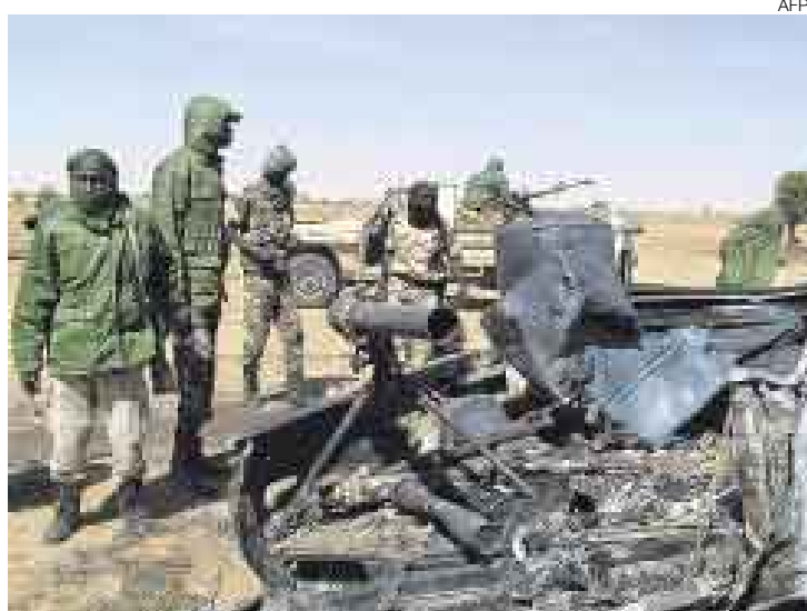
VIOLENCIA. Chad está sumergido desde hace décadas en guerras civiles. En el 2005 varios atentados de rebeldes alarmaron al país.

Los combates entre los soldados y los insurgentes, agrupados en el denominado Comando Militar Unificado (CMU), llegaron