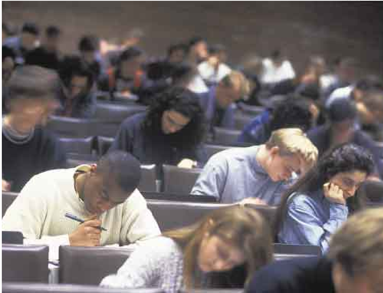
PREOCUPANTE. Según el sindicato de estudios de Francia, un quinto de la población estudiantil de bajos ingresos incursionaría en el negocio del sexo.