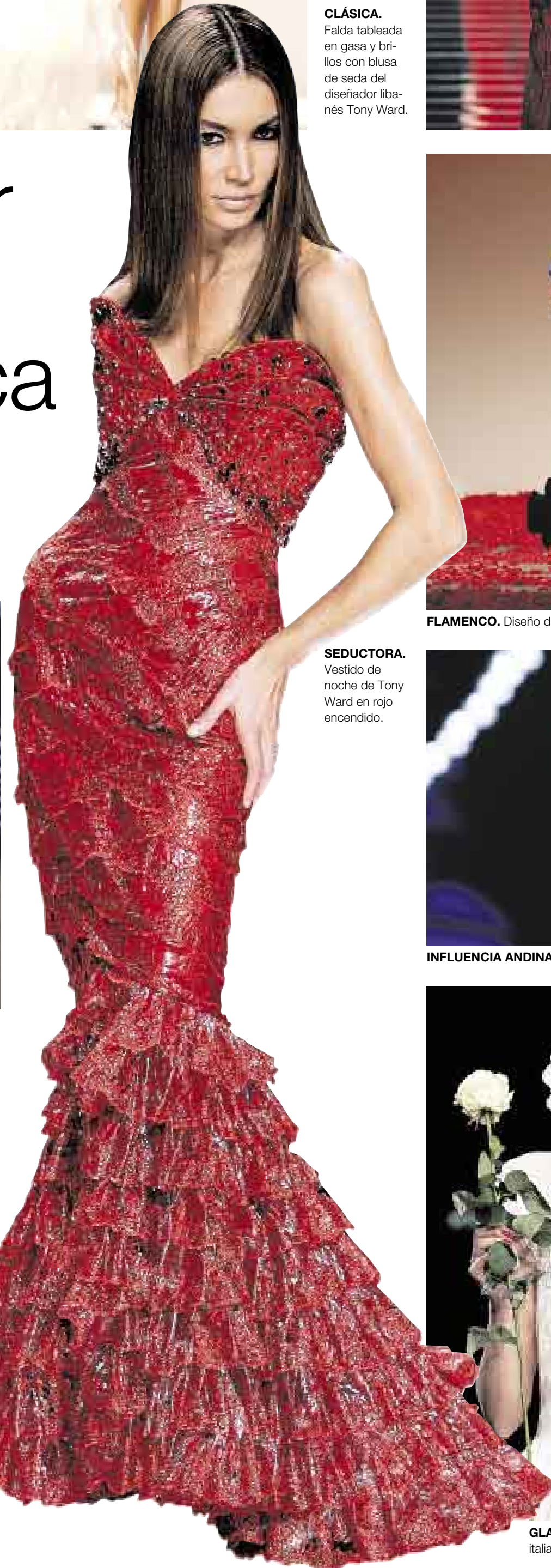
SEDUCTORA. Vestido de noche de Tony Ward en rojo encendido.

de reflejar 'la liberación por la crueldad' de la mujer Carolin Cora Kohler, cerró Cibeles con una delicada y estimulante obra de orfebrería. Inspirada en el arte de la papiroflexia japonesa en la que las formas de las prendas se basan en las fases del plegado, katuskas a juego con medias tupidas, serigrafías de caballos con guirnaldas. Todo para la 'new-Lolita'. ●