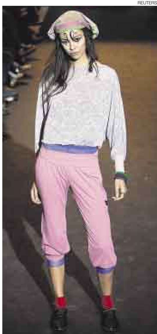
INFORMAL. Una modelo muestra un diseño de Happy Wendy en la pasarela Cibeles.