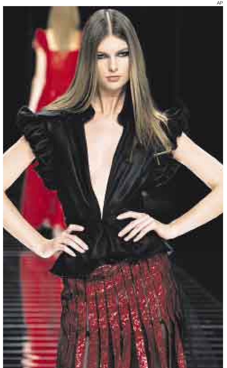
CLÁSICA. Falda tableada en gasa y brillos con blusa de seda del diseñador libanés Tony Ward.