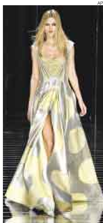
URBANOS. Claro contraste de los diseños de Tony Ward y Carlo Contrada.

★ CIBELES PRESENTÓ A UNA MUJER EXTREMADAMENTE URBANA Y FRÍA