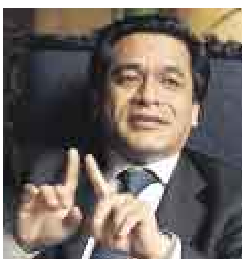
FILTRO. Ministro José Chang.

sonas que presentaron títulos falsos para inscribirse en el concurso nacional y ya las estamos denunciando penalmente”, declaró el ministro luego de reunirse con el presidente Alan García.