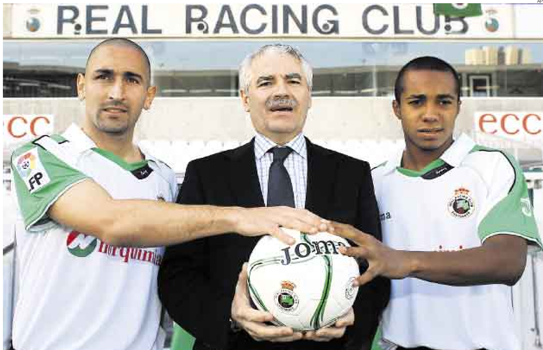
LE QUEDA BIEN. El ex volante de Sporting Cristal, junto a Orteman y el presidente del Racing, posó con su nueva camiseta. Los hinchas racinguistas ya se ilusionan con su juego.