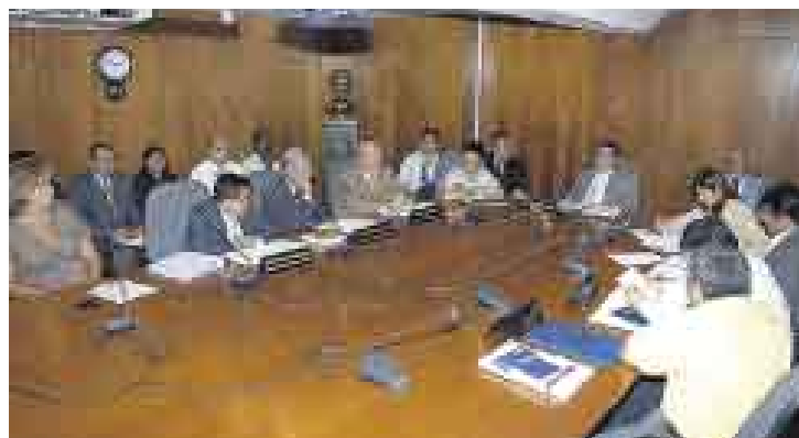
NO TODO ES PERFECTO. Ayer solo faltó un legislador a la sesión. El resto sí se presentó. Lamentablemente, esta vez fallaron los testigos.

Esta vez, por fin, después de tantas sesiones truncas, sí hubo quórum en la Subcomisión de Acusaciones Constitucionales del Congreso. Tras el jalón de orejas dado por el presidente de la República, Alan García, a los ‘compañeros’ parlamentarios para que cumplieran con sus obligaciones, estos se presenta-