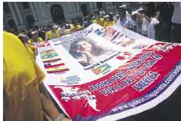
■ PRESENTE. En las calles de Lima también se evocó el recuerdo de Ingrid Betancourt, secuestrada por las FARC.

"Todos los representantes de los diferentes grupos políticos, sin ninguna excepción, están firmando la declaración. Esto nos ennoblecce, afirma la integración, la unidad, los valores y los principios de una causa noble", afirmó el presidente del Parlamento.