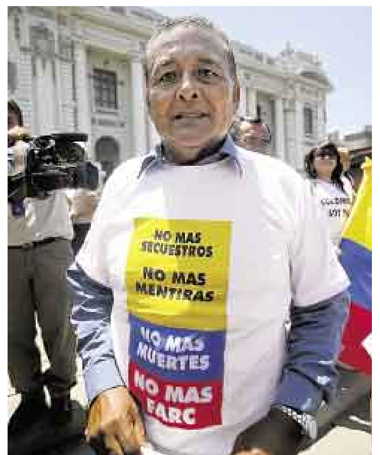
■ SANTA MARÍA. Sobrevivió al terrorismo en el Perú y en Colombia.

Cuenta que sufrió constante maltrato psicológico, cuyas secuelas lo han obligado a buscar ayuda psiquiátrica. "Para mi liberación, le pidieron 400 mil a mi familia. Mi cuñado dijo: serán 400 mil pesos; pero no, querían dólares. Al final negociaron en US$50 mil". "Cuando me soltaron me pidieron que llevara el mensaje 'Nosotros no maltratamos a la gente'. Qué irónico, ¿no?", dice mientras ríe. ■