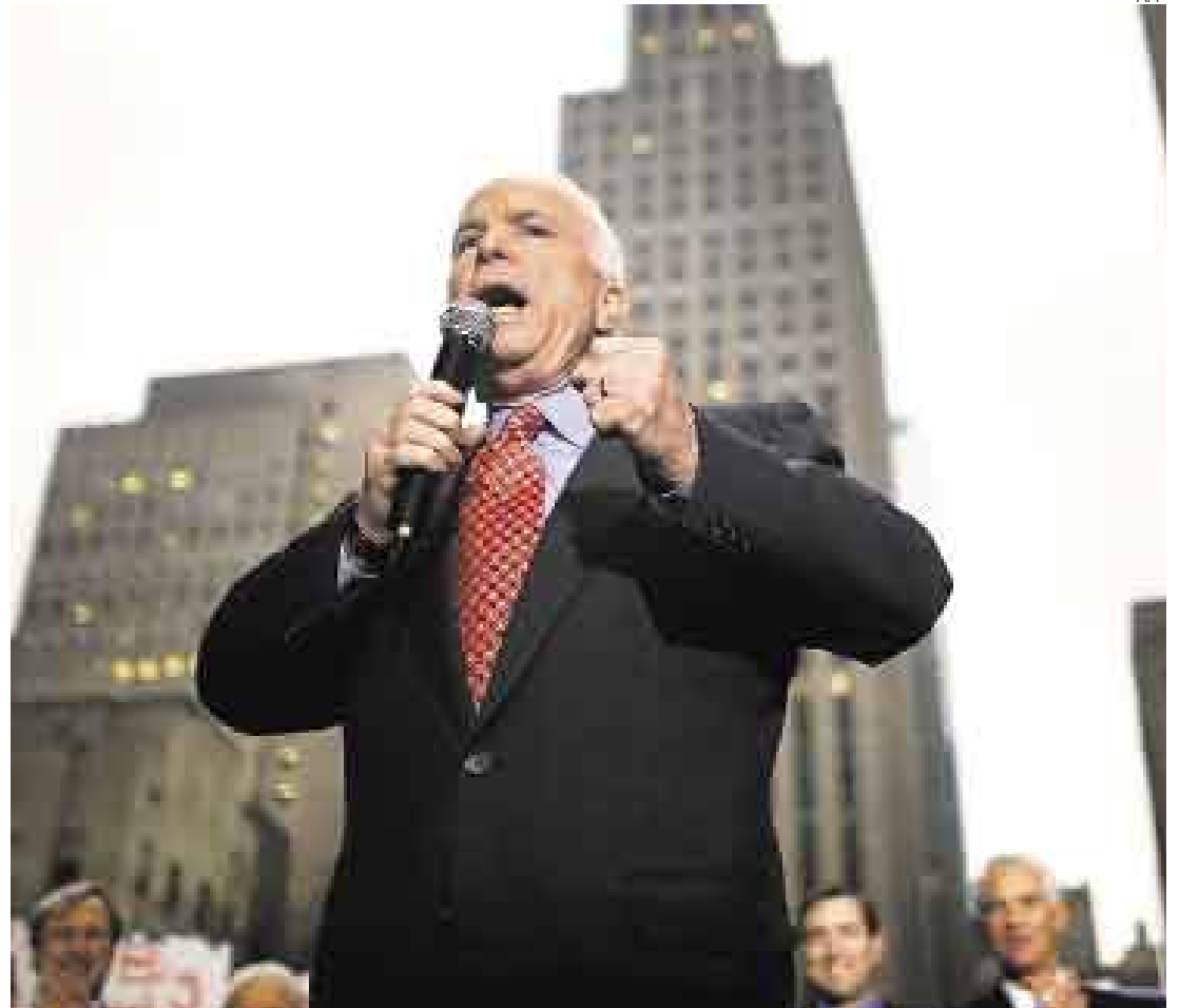
PASO FIRME. Luego de la jornada de ayer, John McCain parece tener seguro el triunfo en las filas republicanas.