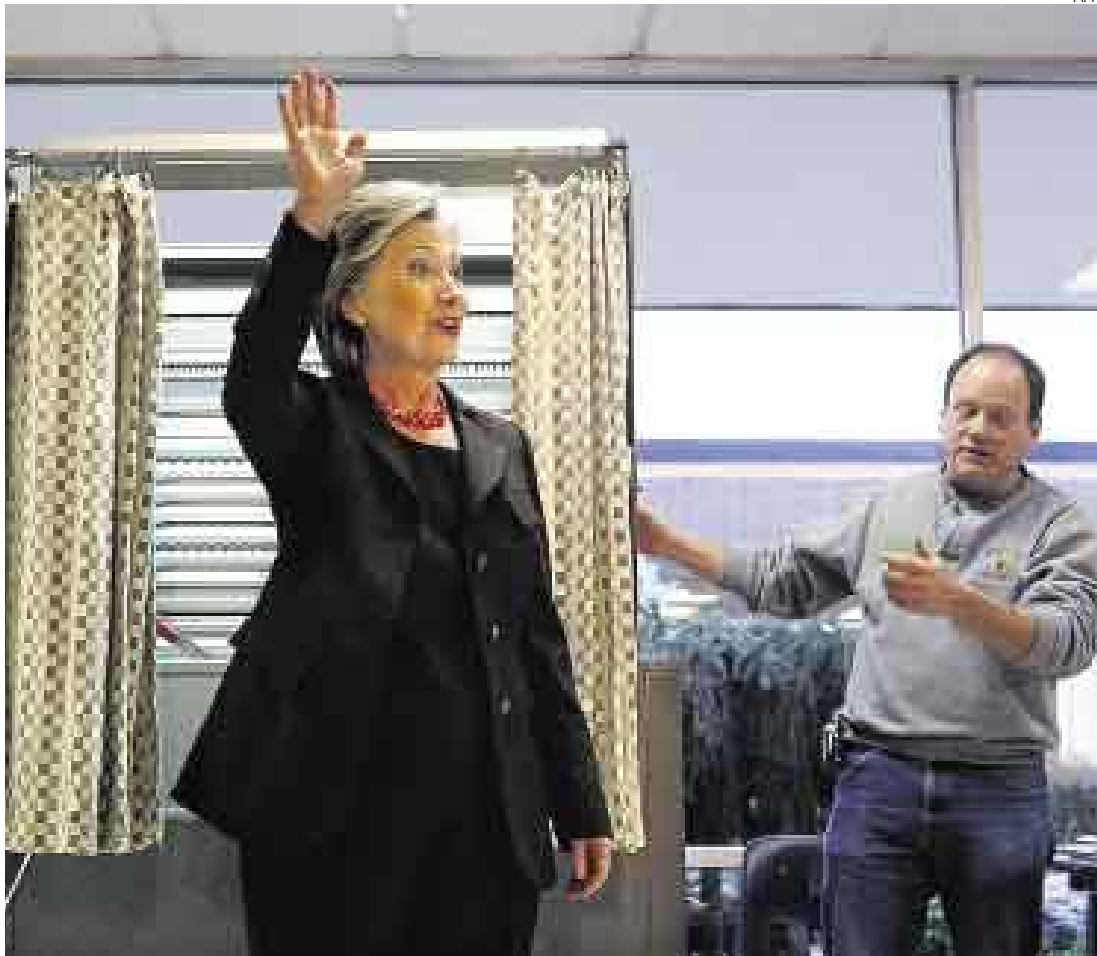
AVANZA. Hillary Clinton dio pasos importantes al vencer en Massachusetts y Nueva York, pero aún falta mucho.

El Supermartes resultó ser una jornada muy apretada para los candidatos demócratas. En el lado republicano parece que John McCain tiene las mayores posibilidades de ganar las primarias