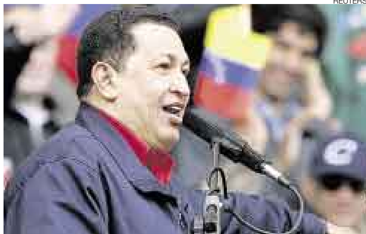
UNA MÁS. El presidente venezolano, Hugo Chávez, fomenta cumbre paralela.

David Lemor, presidente ejecutivo de Pro Inversión, sostuvo: “Hay intereses extranjeros que están tratando de soliviantar y tratan-