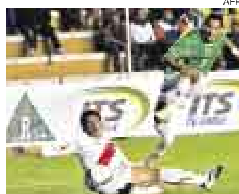
CAYÓ. Se perdió 2-1 en La Paz.