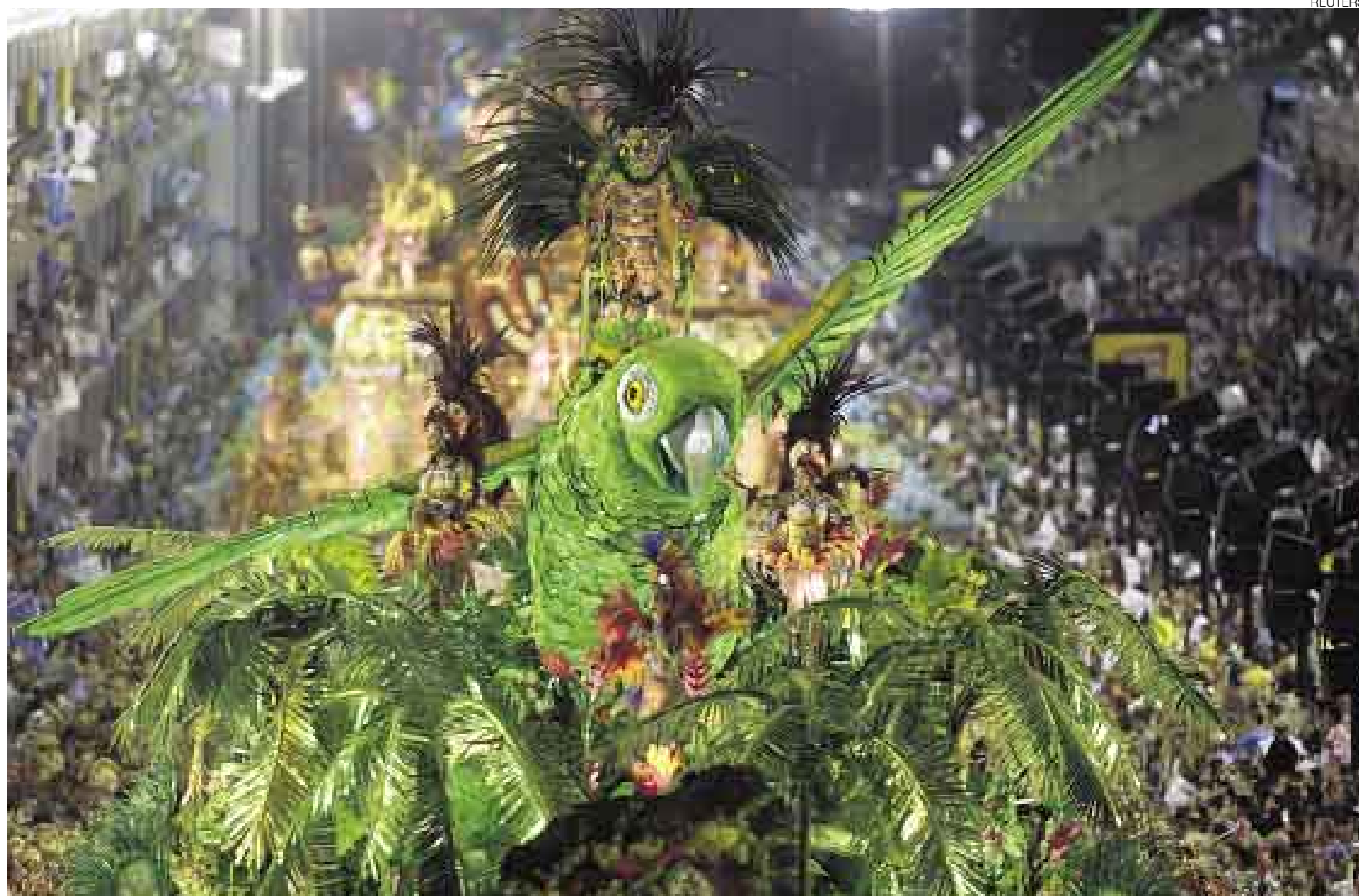
VERDE NATURALEZA, VERDE DÓLARES. El impresionante despliegue que ofreció la escuela de samba Beija Flor costó por lo menos cuatro millones de dólares.