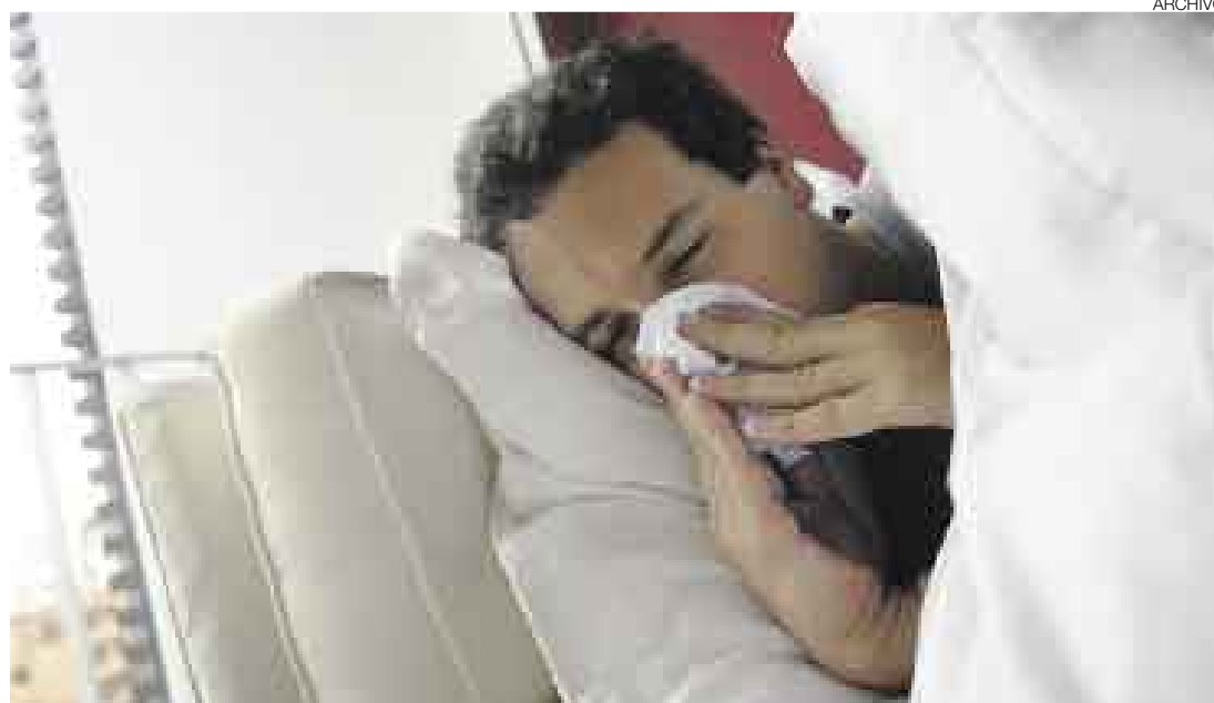
PERSISTENTE. Los procesos virales de la gripe suelen durar alrededor de una semana. Tome mucho líquido.

Aseguró que el 70% de las causas de una rino-faringitis