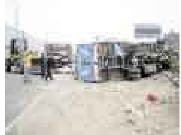
MEJOR HERIDO. Un menor salió herido al volcarse este camión.

Rico, perdió el control del vehículo al cruzarse un automóvil. Un cargador frontal del Concejo de Chacabayo retiró el pesado camión. Un menor que venía en el vehículo resultó con golpes diversos y heridas en la pierna.