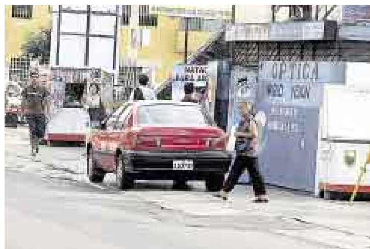
MÁS CAOS. Muchos vehículos se estacionan en la vereda y obligan a los peatones a tener que transitar por la pista. ¿Y dónde está la policía?