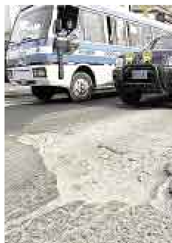
BACHES INMENSOS. Transitar por la Arequipa es una dura prueba.