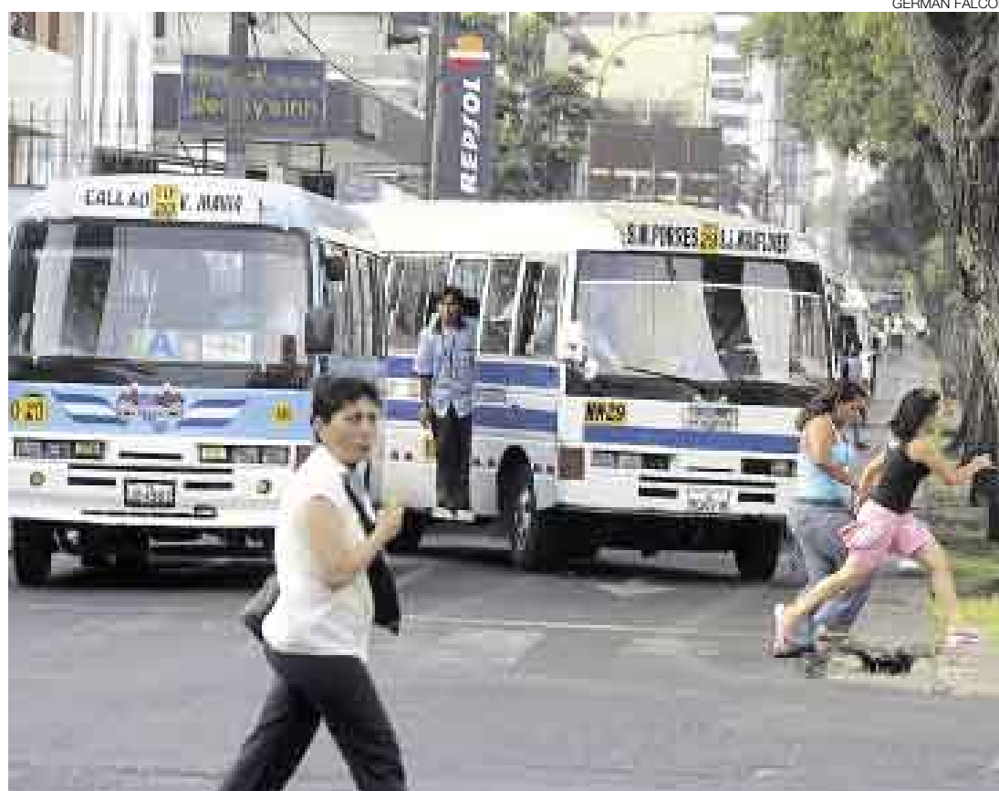
EL IMPERIO DEL DESORDEN. Los vehículos de transporte urbano paran en cualquier esquina de la avenida Arequipa para esperar pasajeros, sin importarles que de esa manera congestionan el tránsito a lo largo de esa vía.