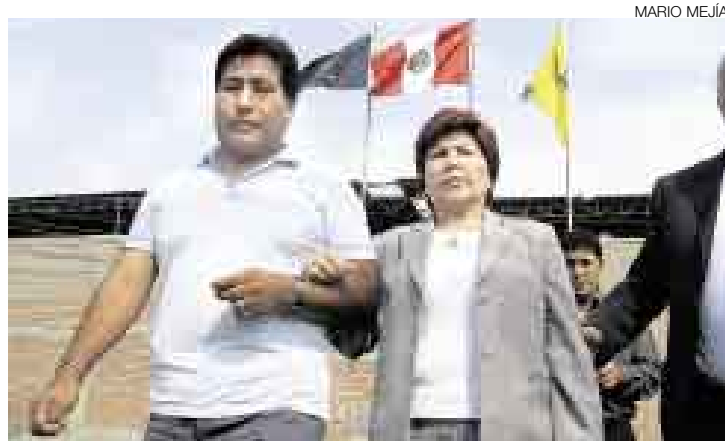
ABSUELTA. La hermana del ex presidente Alejandro Toledo abandona la sala de audiencias del penal de Lurigancho. “Se ha hecho justicia”, afirmó.

Como se recuerda, en los últimos días estuvo delicada de salud, por lo que se debió postergar