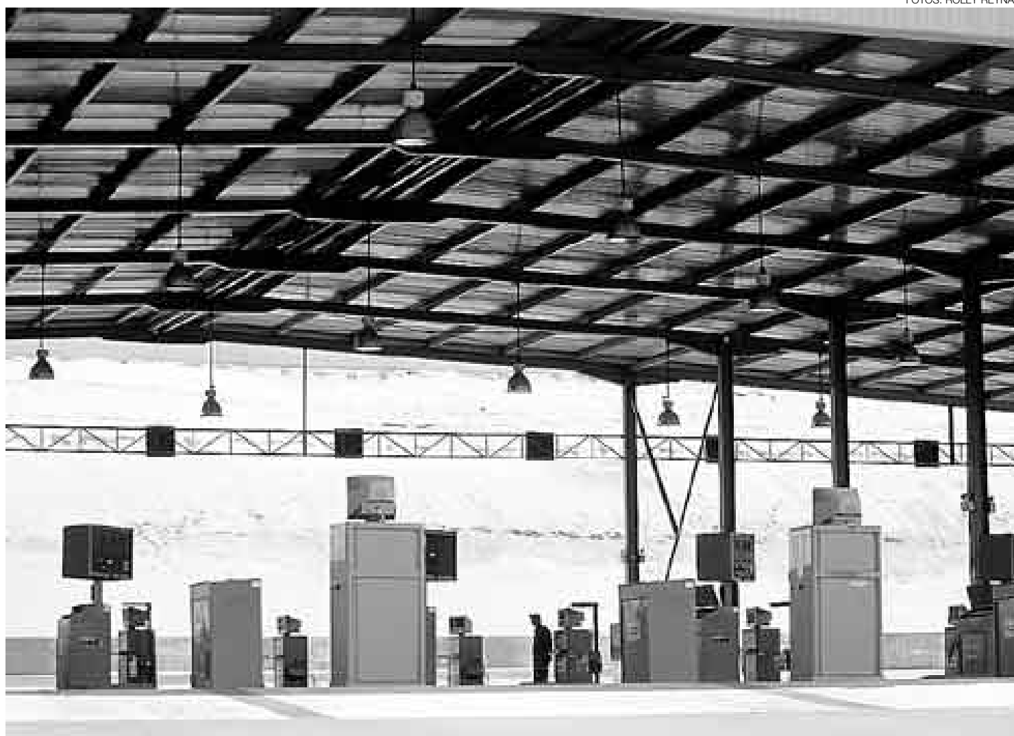
VACÍAS. Así lucieron ayer las plantas de revisiones de Villa El Salvador y San Martín de Porres, después de que se conociera la decisión del alcalde de Lima.

Igualmente queda en el aire saber cuándo y de qué forma se reanudarán las revisiones técnicas vehiculares. "Podría haber dos opciones: que la municipalidad