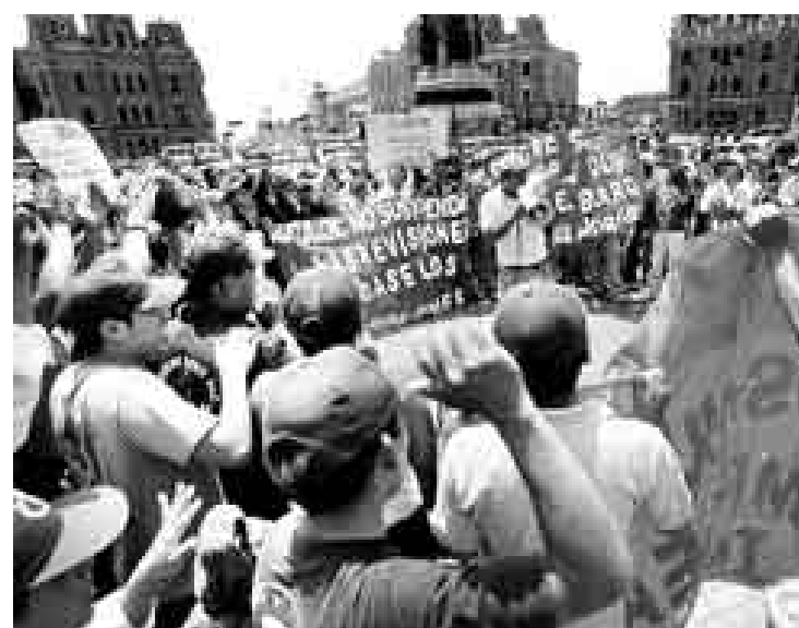
SE QUEJAN. Ayer por la mañana, más de 450 trabajadores de Lidercon marcharon en protesta por el fin de la concesión que los dejaría sin empleo.

"El contrato no se puede suspender de forma unilateral, sino únicamente por casos de fuerza mayor, casos fortuitos o por acuerdo de las partes interesadas", dijo. Sin embargo, Santistevan señaló que en este caso hubo un incumplimiento grave al contrato y, por lo mismo, procede dar por culminada la concesión por la vía de la caducidad. Añadió que la medida