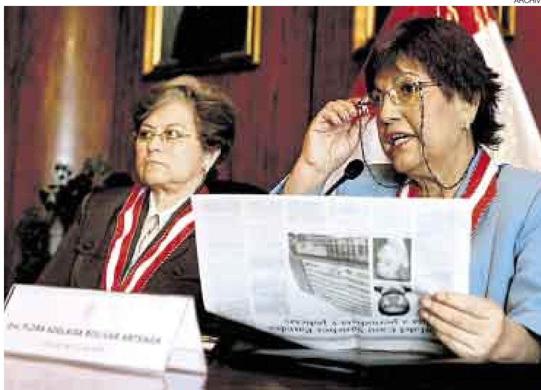
EN SUSPENSO. Bolívar recién sería citada al CNM si la comisión disciplinaria le abre una investigación.

En una reciente conferencia de prensa en la sala de audiencias de la Junta de Fiscales Supremos, Bolívar preguntó: “¿Cuáles