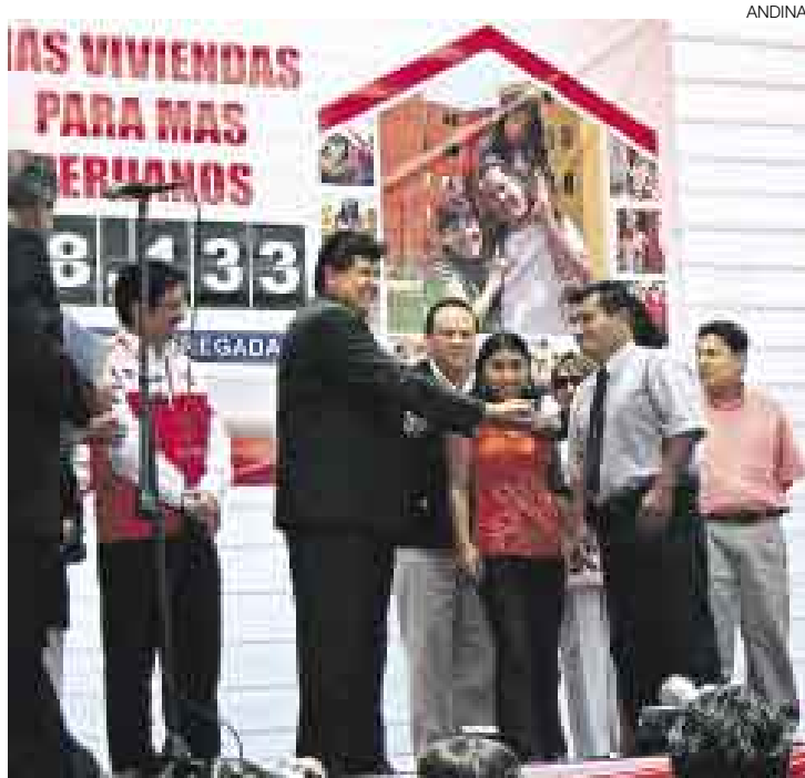
EL APRÁ SE QUEDA. El mandatario descartó que piense en la reelección, pero negó que eso signifique que el Apra dejará el gobierno el 2011.

“Yo no hablo en términos personales. Yo me refiero a la acción política del Partido Aprista y no a la persona. Jamás he pensado en la reelección. Pero no necesaria-