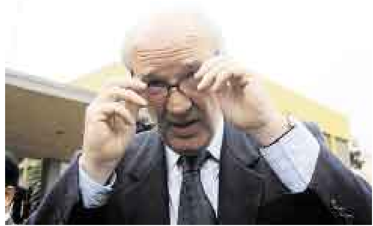
BIEN VISTO. Ministro dice que se logró ‘desfujimorizar’ relación con Japón.