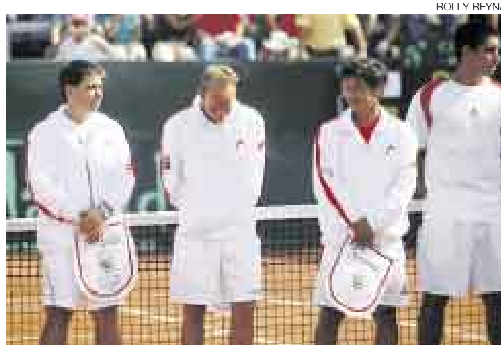
A LEVANTARSE. El equipo peruano está en deuda con la afición.