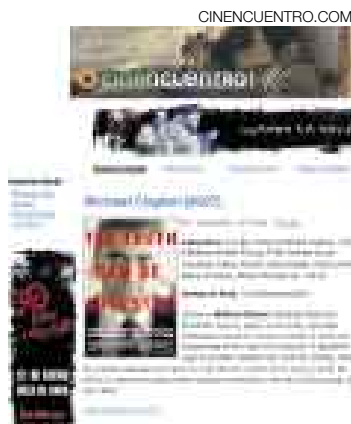
PRODUCTO. Este es su punto de encuentro para conversar de cine.

Rodrigo Portales y Laslo Rojas empezó este proyecto.