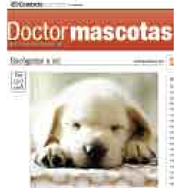
MÁS. Aumentan los espacios para la interacción con los usuarios.