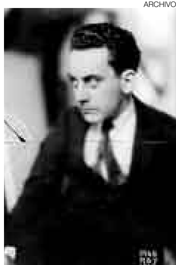
SELECCIÓN. Se mostrarán 250 obras de diferentes épocas.

PARÍS [EFE]. La Pinacoteca de París presentará a partir del 5 de marzo una retrospectiva con obras inéditas del artista estadounidense de origen ruso Man Ray, que comprende dibujos, fotografías, esculturas, estampas personales y objetos diversos, anunciaron sus directivos.