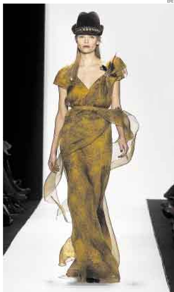
ORIGINAL. Traje de organza estampada con falda en capas superpuestas y como accesorio el sombrero tirolés y plumas de faisán.