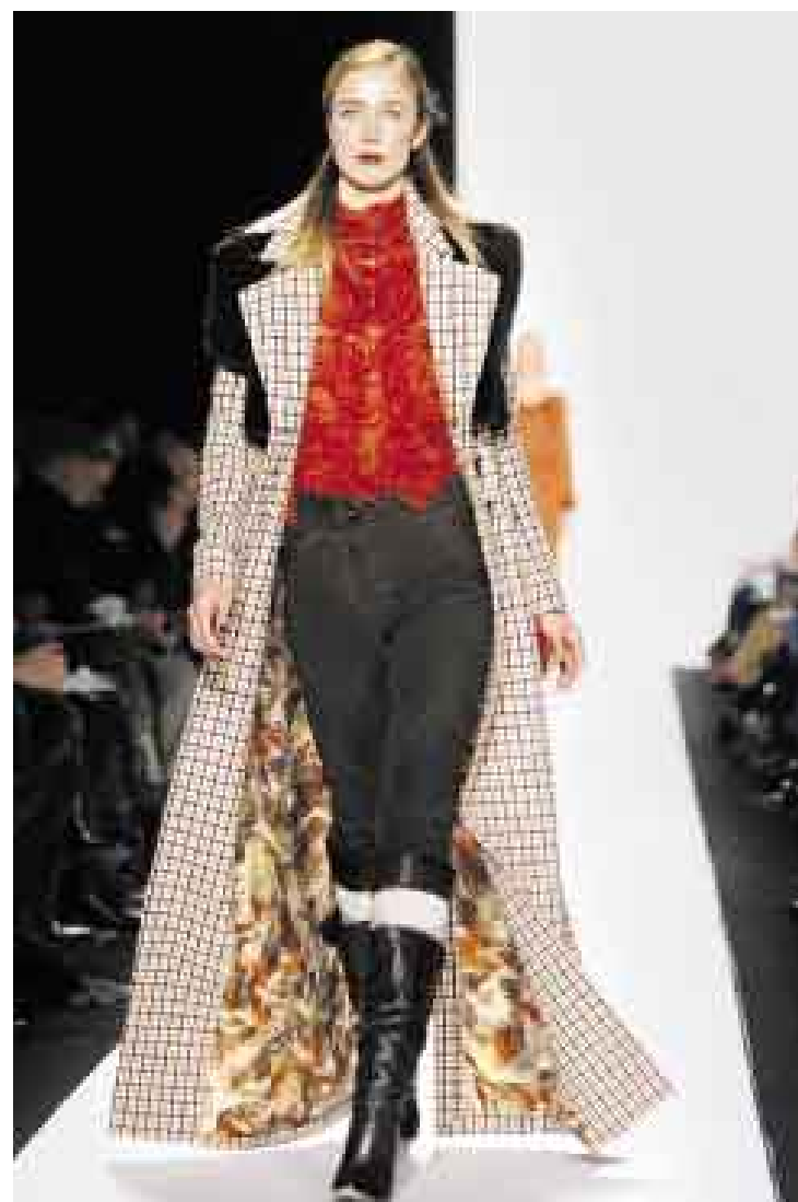
TRADICIONAL. Abrigo largo a cuadros, pantalones de amazona y blusa de gasa transparente.