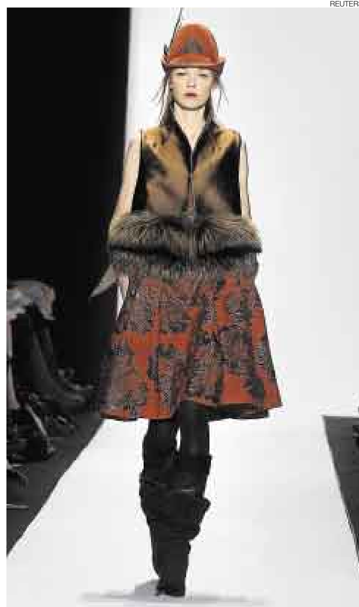
CASUAL. Falda en seda con bordados, chaleco de seda con borde de visón y botas de gamuza marrón del diseñador Manolo Blahnik.