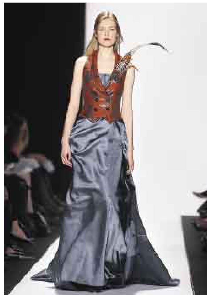
ELEGANTE. Traje de noche en azul acero con chaleco ocre con estampado en hilos dorados y como broche unas plumas de faisán.

ciudad. "Mi inspiración ha sido el campo en cualquier lugar, puede ser el de España, Inglaterra, Francia o Estados Unidos", declaró. Son diseños que cuentan con chaquetas de cortes masculinos en tweeds combinadas a veces con hiperfemeninas faldas rectas en lana o con espectaculares faldas largas en terciopelo o seda. Sus propuestas son "acercas de los caballos y de los perros, de un fin de semana en el que está toda la gente junta" y también "con mucha fantasía" en las mezclas de formas y tejidos, así como de los complementos, sin faltar los pantalones, definitivamente de vuelta, de cintura alta y con corte amazona. Calza a sus modelos con botas de capas superpuestas con sofisticados trajes de noche, en su mayoría adornados con espectaculares plumas de faisán, con las que ha hecho los sombreros de caza, también para la noche. ●