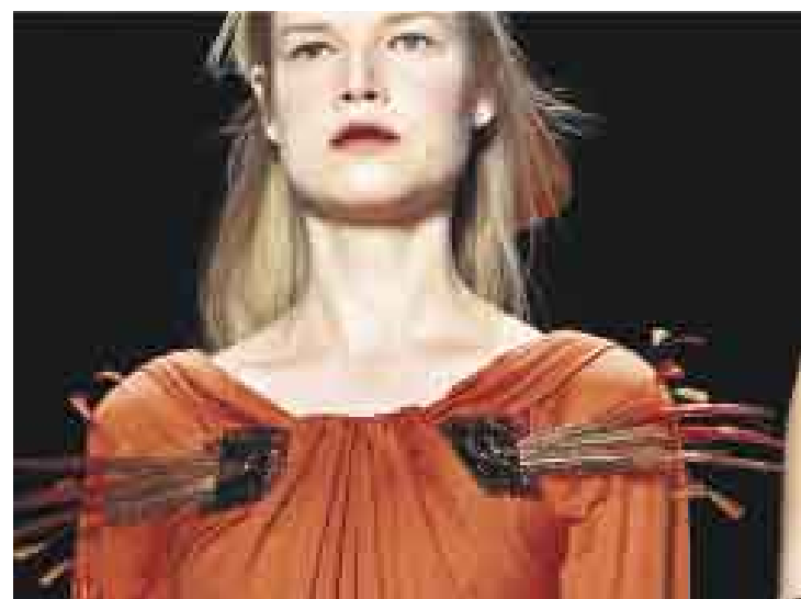
FEMENINOS. Vestido de lana con doble broche de pedrería y plumas (arriba). Mangas de plumas forman el escote de este traje de noche (abajo).