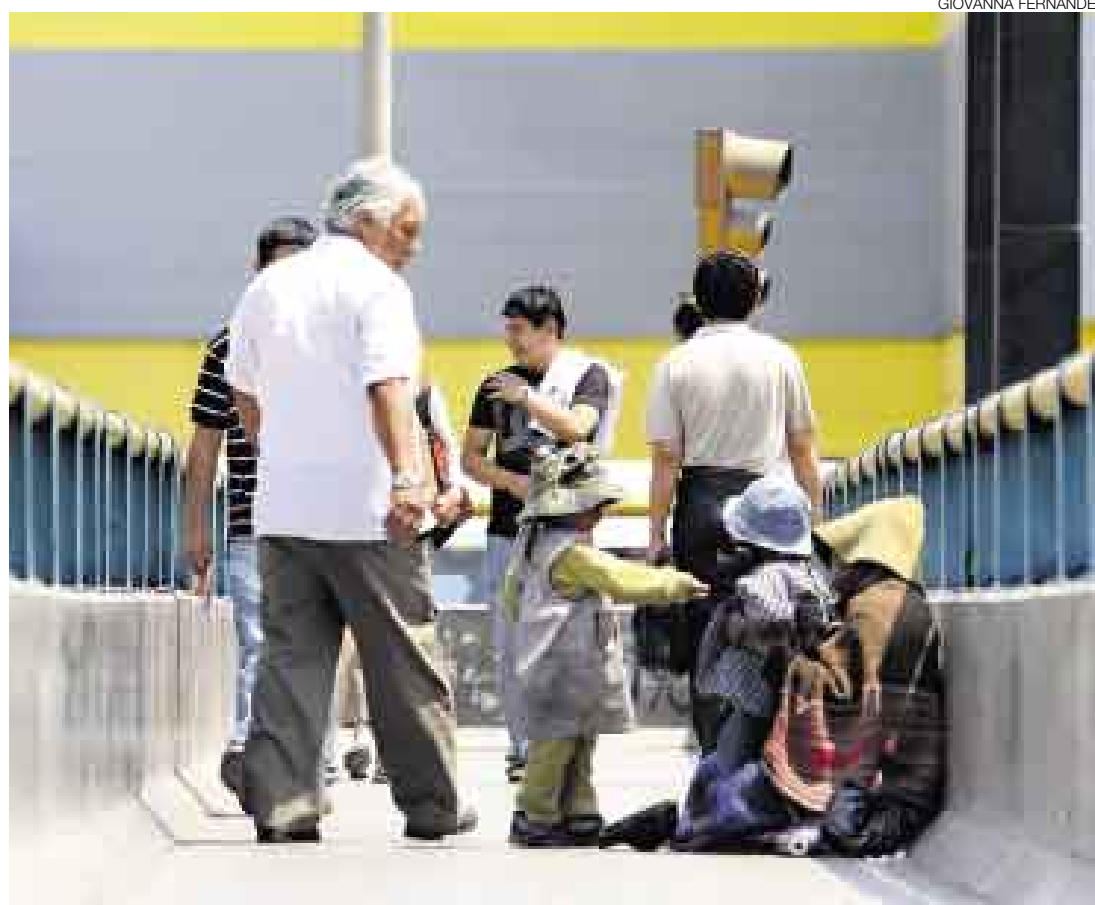
SAN BORJA. En el puente ubicado en el cruce de las avenidas San Luis y Javier Prado, hombres y mujeres se instalan con menores que dicen son suyos. Los niños saben que deben entregarles todo lo recaudado.