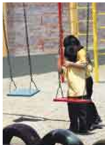
ESPERAN. Los 23 niños rescatados en Miraflores están en un albergue

delito es difícil de probar, pues no se realiza un trabajo de inteligencia previo para recabar evidencias", refiere el fiscal superior de Familia, Walter Rojas. "Los padres vienen, presentan la partida de nacimiento y se los llevan porque no podemos comprobar que los alquilaron; y si fueron captados en provincia no hay quien los reclame. Son redes delictivas y se debería enfocar los mismos esfuerzos que para la lucha contra el narcotráfico", agregó.