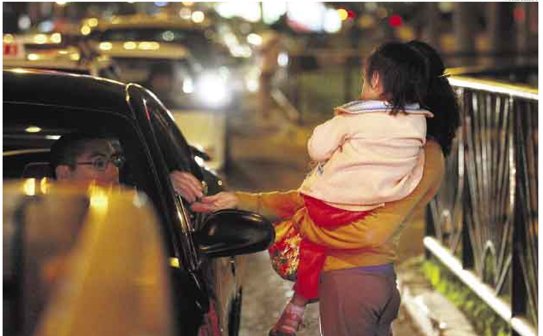
OBJETOS DE BENEFICIO. Los explotadores suben a los buses con niños en brazos, caminan con ellos o se sientan en veredas para apelar a la lástima. Así sean sus hijos, los están usando.

Desde el verano pasado, dos de seis niños puneños hallados mendigando en el Cercado permanecen en un albergue del Mimdes. Sus padres no han sido identificados, y los sujetos que fungían de ellos huyeron cuando se les exigió que demostraran su filiación en el proceso de investigación tutelar. Como muchas otras leyes en el país, la Ley 28190 de Protección del Menor de la Mendicidad es aún letra muerta. "Hasta hoy no se ha podido denunciar a nadie porque este