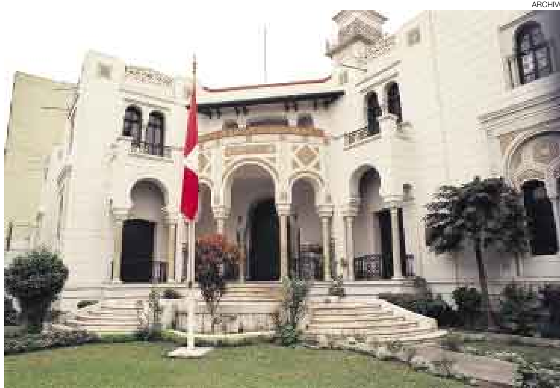
LEY POR MEJORAR. El Consejo Supremo de Justicia Militar se ha opuesto a los cambios a la norma promulgada.

Sin embargo, el TC indica que los magistrados castrenses deben ser oficiales en retiro y tienen que ser elegidos por el Consejo Nacional de la Magistratura (CNM).