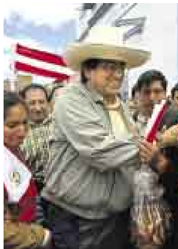
RECUERDO. El primer ministro Del Castillo estuvo en Cajamarca.

Empezaron los deslindes al interior del partido de gobierno luego de conocerse el deseo presidencial de que el aprismo debería continuar en el poder después del 2011. Ayer, desde Cutervo (Cajamarca), el presidente del Consejo de Ministros, Jorge del Castillo Gálvez, negó que el gobierno incurra en proselitismo político y de paso rechazó que pretenda alguna candidatura electoral de cara a los comicios