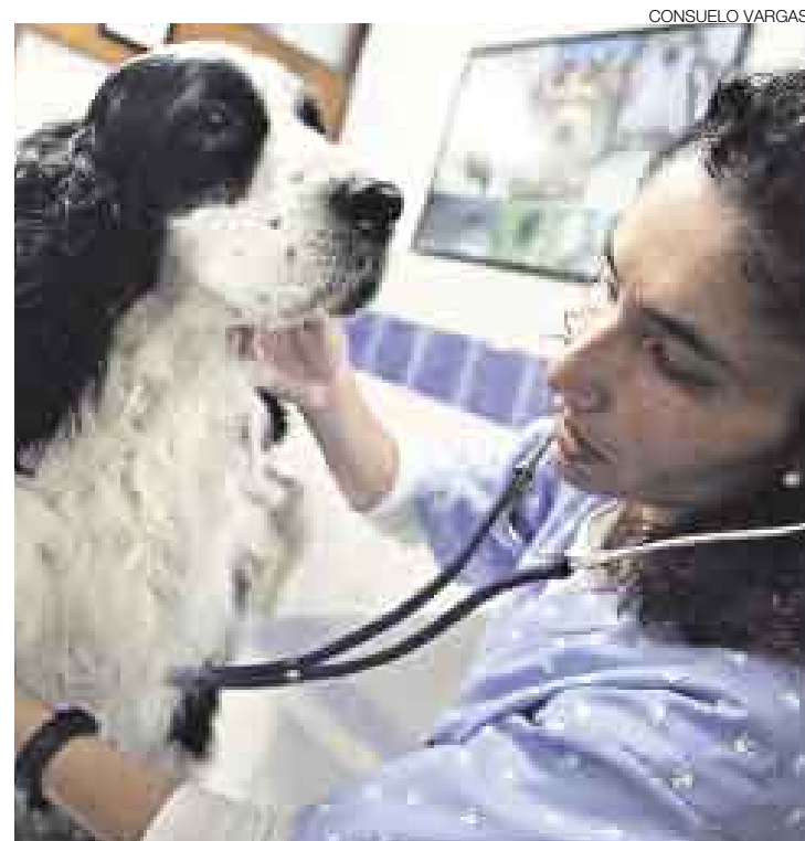
DEMANDA. El costo en las veterinarias se ha incrementado por el aumento en la demanda de sus servicios.

El economista Richard Webb dijo que las subidas de precios de servicios registradas por el INEI no sorprenden. “Ya no es como hace siete años, cuando todo el mundo estaba un poco de capa caída y había mucha renuencia a subir precios. Ahora todos están vendiendo y todos encuentran una justificación para subir los precios”, explicó. Webb afirmó que hay mucha evidencia de un mayor movimiento en la economía. “Y cuando uno vende con más facilidad y hay más clientes, también es más fácil subir los precios. Entonces uno sube un poquito, el otro sube otro poquito y así el promedio termina subiendo”.