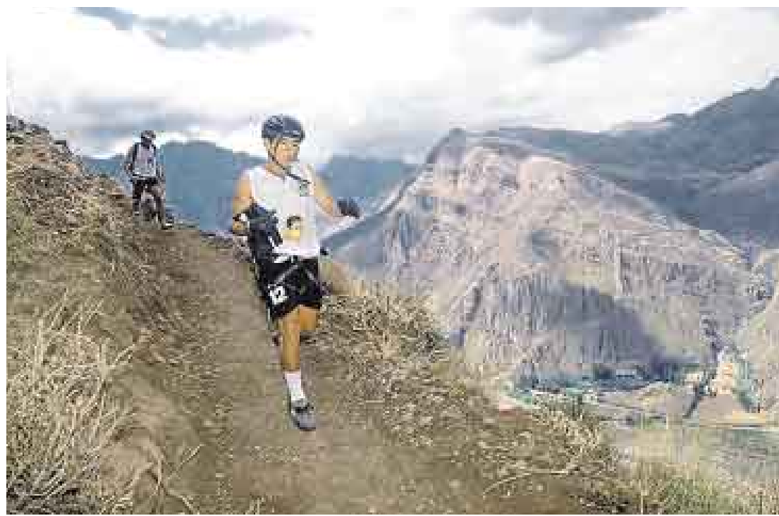
A LA CARRERA. Soportar el calor y el duro camino de tierra son parte de la competencia. Los equipos bien preparados serán los únicos que podrán terminar el trayecto que tendrá un recorrido de 250 kilómetros en total.