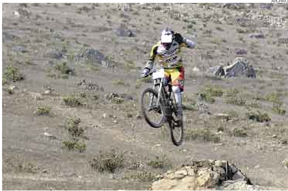
ESPECTACULAR. Los competidores tendrán que recorrer 130 kilómetros en bicicleta, una distancia larga y agotadora que dejará en claro de qué están hechos los deportistas. Solo los valientes terminarán la carrera.