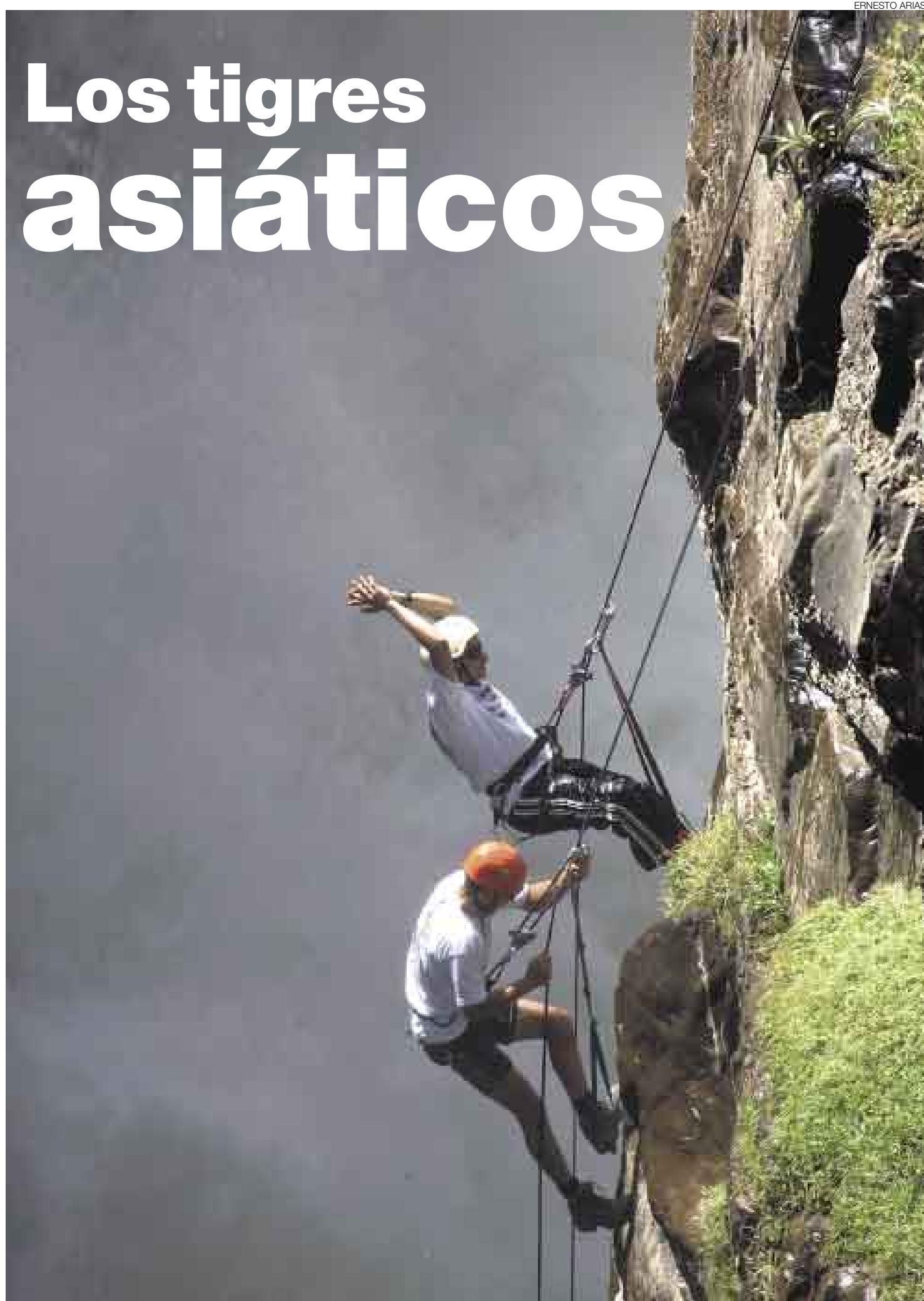
ARRIBA VAN. Escalar cerros o montañas tienen un grado de dificultad alto y solo los deportistas preparados podrán superar este duro reto.