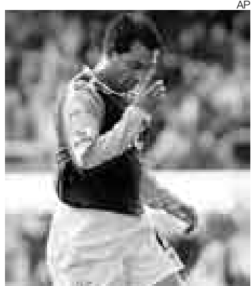
LO JUSTO. Fifa.com eligió a Nol como el rey de la pelota parada.

“Nuestro debate semanal fue tomado muy en serio por los peruanos, que se volcaron a votar en gran número por Nol. Como resultado, se registró una cifra récord de opiniones en nuestra sección: más de 32.000 palabras provenientes de unos 1.000 usuarios. Por detrás de Solano se