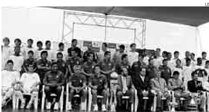
PRESENTACIÓN. El campeón estrenó la nueva camiseta que utilizará.