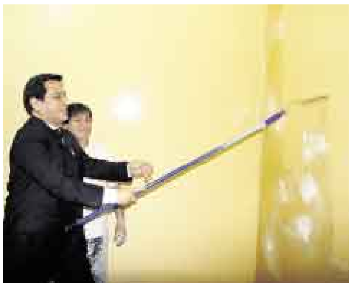
MANO DE PINTURA. Chang supervisó las obras de mejoramiento en el colegio Miguel Grau de Magdalena del Mar y colaboró con el trabajo.

■ Son proyectos relacionados con dotación de textos y materiales educativos, capacitación docente, mantenimiento y equipamiento de planteles.