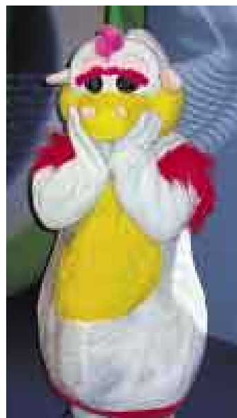
FESTEJA. El dragón recibirá la visita de los chicos de "América Kids".

Además, adelantó que los cambios en el programa se darán a partir de marzo próximo con la llegada del año escolar. "Se quiere que el programa de fin de semana empiece más tarde, las 6 de la mañana es muy temprano", finalizó. ●