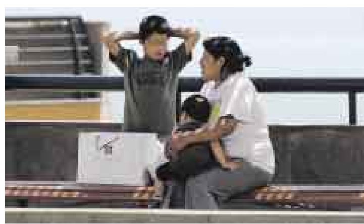
[3] El niño lleva lo recaudado a una señora que le pide buscar más dádivas.