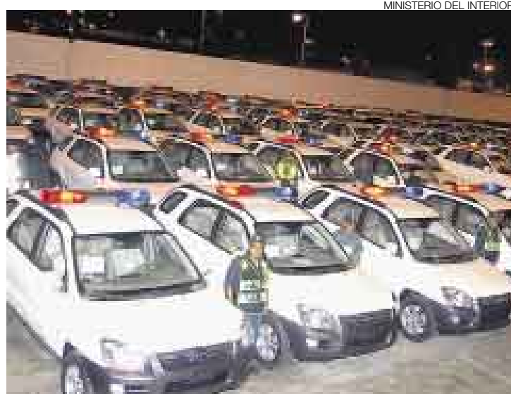
MÁS RESGUARDO. Con la llegada de este lote de nuevos vehículos coreanos, la PNP podrá aumentar el patrullaje en las calles de Lima.

“Han llegado cien patrulleros gestionados directamente por el