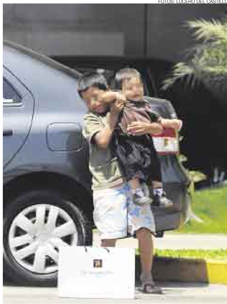
[1] Luego de recibir regalos de unos turistas, los niños buscan más limosnas.