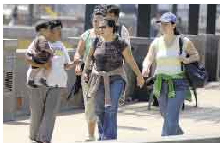
[4] La mujer carga al más pequeño y también empieza a pedir limosna.