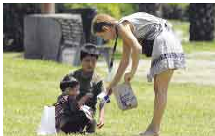
[2] En Larcomar, una transeúnte se apiada de ellos y les da algo de comer.

La Guía de Intervención contra la Mendicidad, derivada de la Ley 28190, advierte sobre las secuelas psicológicas y sociales en los niños mendigos: “Introversión o agresividad, resentimiento, retraso en el desarrollo intelectual, acceso a drogas, riesgo de abuso sexual, entre otros”. La campaña que iniciará el Ministerio de la Mujer para erradicar este problema deberá enfocar, también, asistencia a los menores para evitar secuelas irreparables. ■