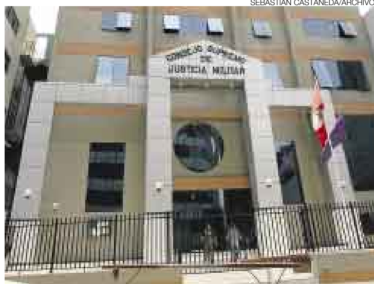
CEDEM. El Consejo Supremo de Justicia Militar está a favor de la ley cuestionada por el TC, pero respetará la opinión de la instancia supranacional.