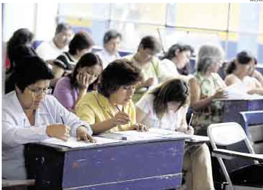
CONSENSO. En lo que todas las autoridades coinciden es en la necesidad de elevar el nivel de los docentes.

Ese mismo día, en la tarde, el presidente del Consejo de Ministros, Jorge del Castillo, ha citado a su despacho a las autoridades regionales para intercambiar ideas y explicar detalladamente los alcances de la norma. “Este diálogo no significa dar marcha