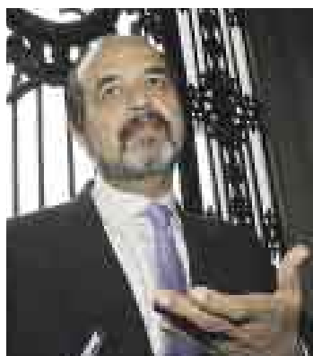
¿SE QUEDARÁ? Mulder asumió el cargo en junio del 2004.

“Probablemente, sí (vuelva a postular). Pero estas son circuns-