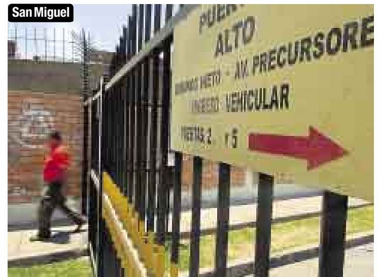
REALIDADES. Los Olivos, La Molina y San Miguel son tres distritos donde abundan las rejas cerradas, sin vigilantes o en las que se pide identificación antes de ingresar. Tres ejemplos de violación a la ordenanza municipal.