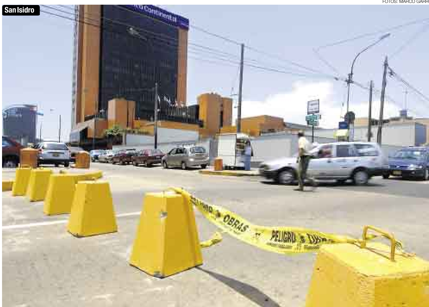
POLÉMICO. Lectores de este Diario denunciaron la instalación, pese a no haber obras, de hitos en el cruce de la calle Las Tordillas con República de Panamá.