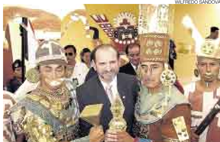
SEÑORES. Los actores que representan a los señores de Sipán y Sicán participan en diversos espectáculos que se realizan por las noches.

Las autoridades regionales y los organizadores de la feria denominada FIT Perú tienen grandes expectativas porque, en el corto plazo, se espera que el turismo se incremente en un 70% en estas tierras, que fueron