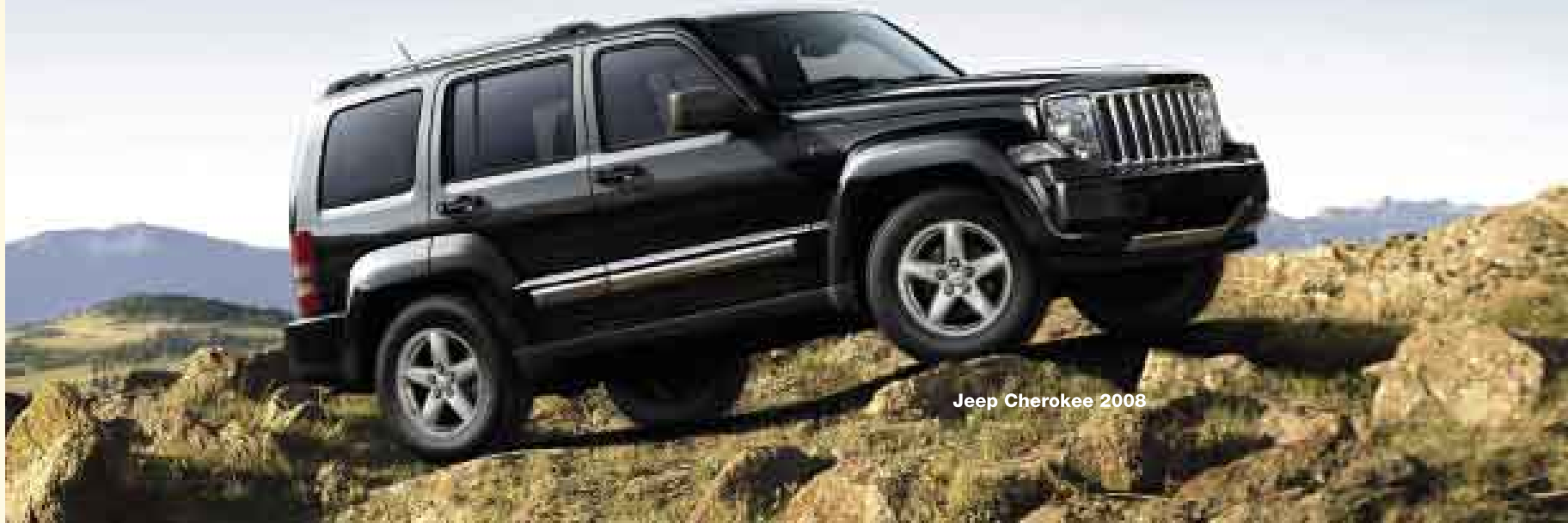
Jeep Cherokee 2008