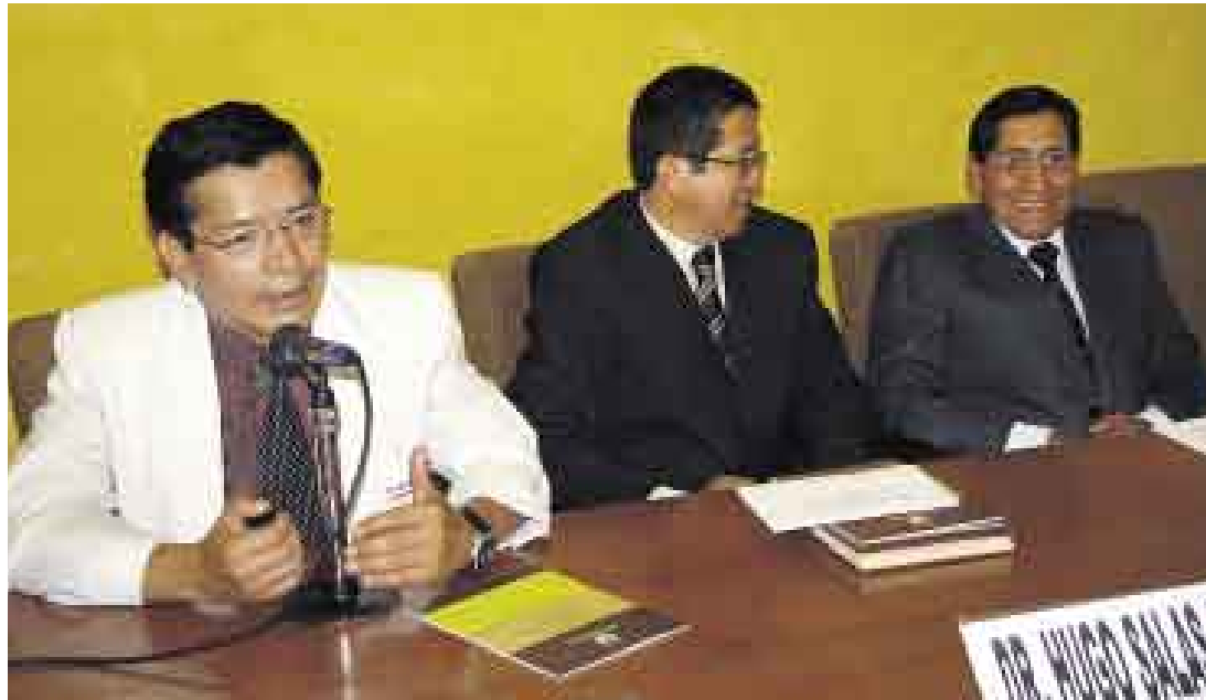
DISCUSIÓN. Médicos y abogados se reunieron en la Ciudad Blanca para defender el protocolo.

Además, considera el procedimiento administrativo que debe seguir una paciente para acogerse al aborto terapéutico. El caso debe ser revisado por una junta formada por tres médicos, quienes pueden solicitar consulta a un cuarto profesional especialista. Establece también la técnica