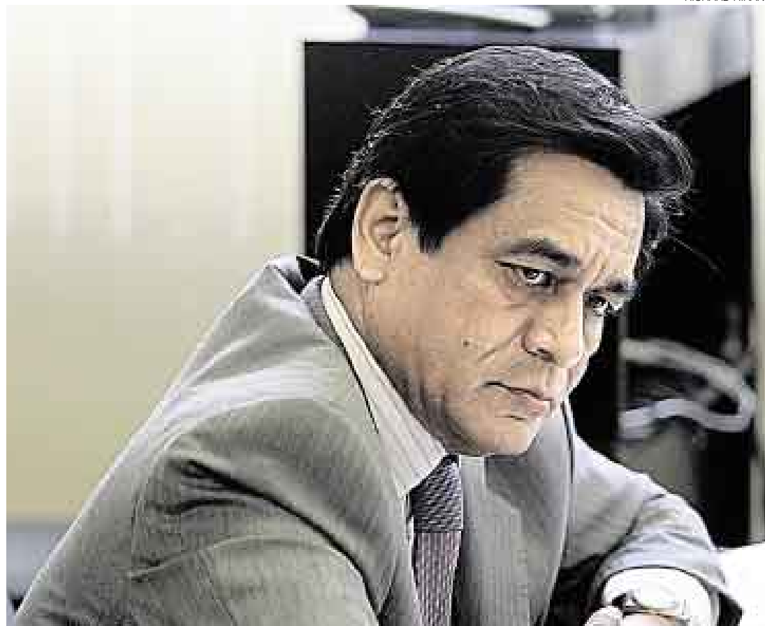
ALUMNO APLICADO. “Sí, por supuesto; creo que un poco más arriba: en el quinto superior”, respondió el ministro Chang cuando le preguntaron si había terminado los estudios dentro del tercio superior.

En esta circunstancia insistió en desenmascarar a la facción radical de la dirigencia del Sutep. “Lamentamos que (esa dirigencia) esté chantajeando a los presidentes regionales. Les garan-