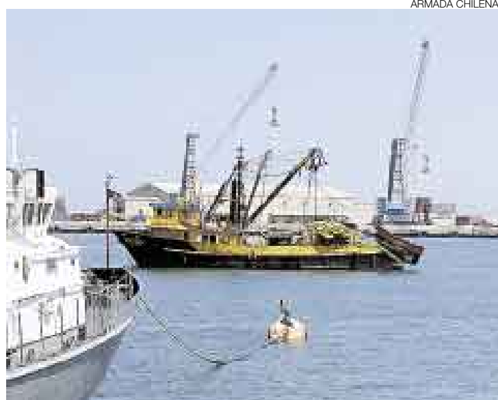
ATRAPADA. La embarcación Águila perteneciente a la empresa Los Halcones fue llevada al puerto de Arica. Ayer retornó al país.

Águila es una embarcación de regular tamaño que pertenece a la empresa pesquera Los Halco-