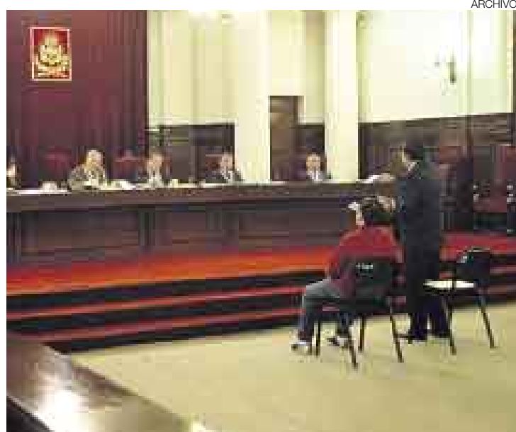
BUSCAR. Es necesario identificar dónde se forman los 'cuellos de botella' en los procesos judiciales para darles solución y aligerar los procesos.

"Otra forma de mejorar podría ser supervisar y ayudar a los jueces y auxiliares a mejorar sus métodos de tramitación de los proce-