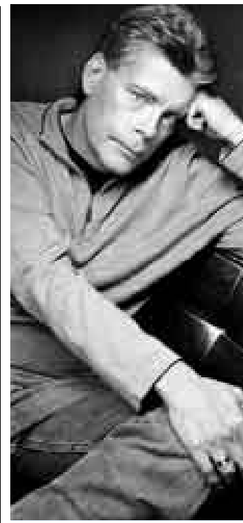
KING. Un nuevo susto del exitoso escritor estadounidense.

Lisey estuvo casada veinticinco años con Scott Landon, un escritor de enorme éxito y gran prestigio literario. Después de dos años de la muerte de Scott, impulsada por su hermana Amanda (que sufre alteraciones mentales y parece hablar en conexión con el escritor muerto) y por el asedio de un admirador psicópata de su marido, Lisey se enfrenta al abismo de sus recuerdos (que ha evitado hasta entonces, entregada a su amor omnipresente: un espantoso viaje a Boo'ya Moon, un lugar al que huía Scott desde niño y al que se llega con concentración mental, donde la locura y la muerte aguardan.