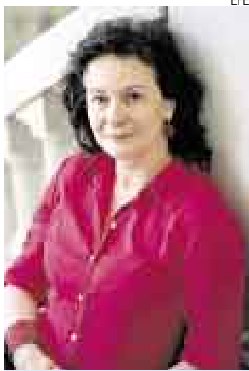
EN COMA. La escritora mexicana asume todo un riesgo literario.

MÉXICO D.F. [EFE]. A quién no le ha intrigado alguna vez saber qué pasa por la mente de una persona en coma? Clara Sánchez se atreve a imaginarlo en su nueva novela, "Presentimientos", una obra de suspense psicológico y de trasfondo científico que acaba de llegar a las librerías. Publicada por Alfaguara, "Presentimientos" es sin duda la novela más ambiciosa de Clara Sánchez (Guadalajara, 1955), y es "una mezcla de sueños, realidad cotidiana, supervivencia y humor", como dice la autora, en una reciente entrevista en la que adelantaba las claves del libro.