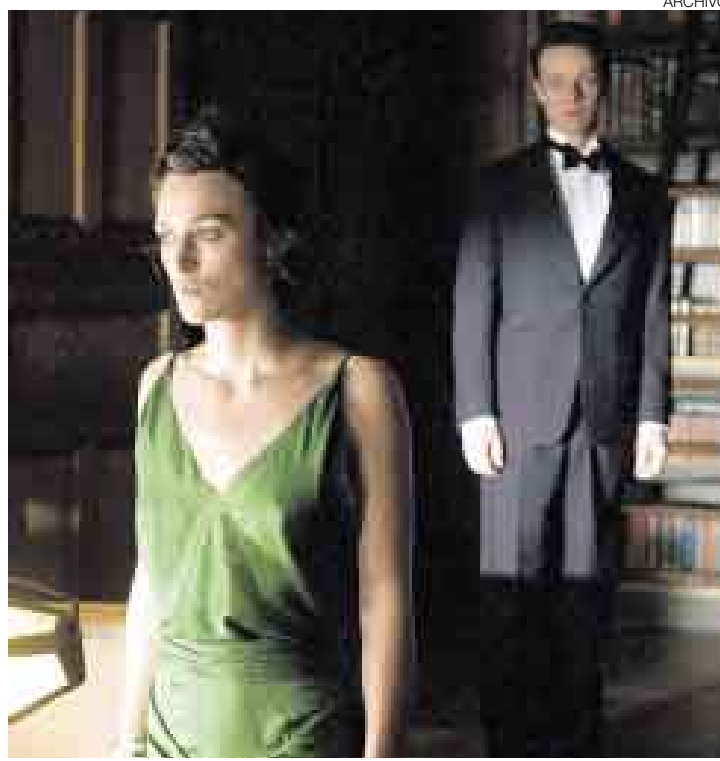
VIDAS CRUZADAS. Keira Knightley y James McAvoy protagonizan este espléndido largometraje del realizador británico Joe Wright.

Pero, más allá del pertinente romanticismo de su argumento (con mucho tino fue estrenada el pasado jueves, fecha en el que se celebra el llamado Día de San Valentín, como para que los espectadores entiendan que en una sala de cine el amor no necesariamente tiene que ser contaminado siempre por la huachafería), la película también nos enfrenta a otros temas cruciales, como el peso de la