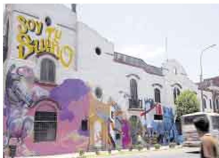
2006 Y 2007. A la izquierda fotografía tomada cuando empezaron la intervención sobre las paredes donde había graffitis que pintaron el 2006.