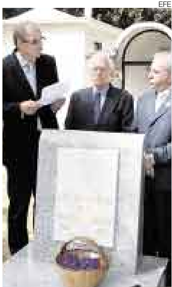
OFRENDA. Renovada lápida para el miembro de la Generación del 27.

MÉXICO [EFE]. El poeta español Luis Cernuda recibió el pasado jueves un homenaje en el Panteón Jardín de Ciudad de México, donde se presentó la restauración de la lápida que recuerda al escritor, exiliado en este país y figura destacada de la Generación del 27.