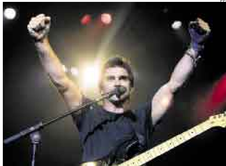
UN RATICO. Juanes compartió con la prensa su asombro por su gran éxito.

"Es diferente el público que no es latino. Una pequeña minoría entiende las canciones, pero la gran mayoría se conecta por la melodía", dijo en una rueda de prensa en la capital mexicana donde promociona su álbum. "Al principio me frustraba porque sabía que no me podían