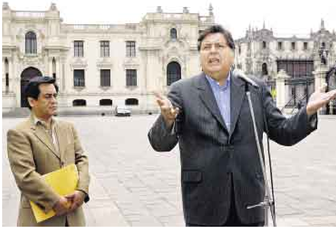
GARCÍA Y CHANG. El presidente de la República dijo que ambos son producto de la educación pública.

Repitiendo lo que ya le había adelantado a El Comercio el 13 de febrero, el titular de Educación dijo que “los maestros que, no siendo del tercio superior, pero que participaron en la evaluación censal del 2007, que hayan alcanzado los niveles suficientes en comprensión lectora, razonamiento matemático, conocimiento del diseño curricular y de su especialidad, podrán también parti-