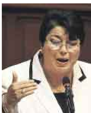
EXAMEN. La defensora del Pueblo rompe su silencio.

Durante su participación en el programa “Sin rodeos”, la titular de la Defensoría del Pueblo informó que su despacho remitirá al Congreso de la República ese informe “para contribuir con el debate parlamentario, en vista de los proyectos de ley que se han