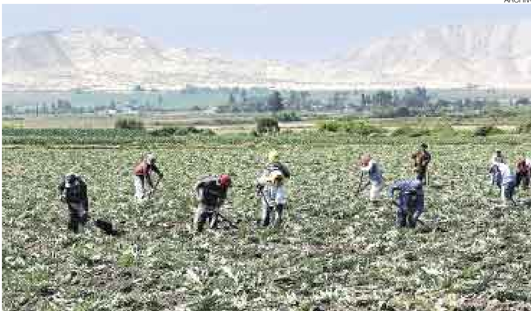
NO IRÍAN A LA HUELGA. Las bases de juntas de riego que no acatarían el paro serían mayoría.

agua, que se nos amenace con una huelga, eso está muy mal porque no se reconoce lo que el país está dando. Si estamos ayudando todos los peruanos con esta forma indirecta de subsidio", refirió el mandatario.