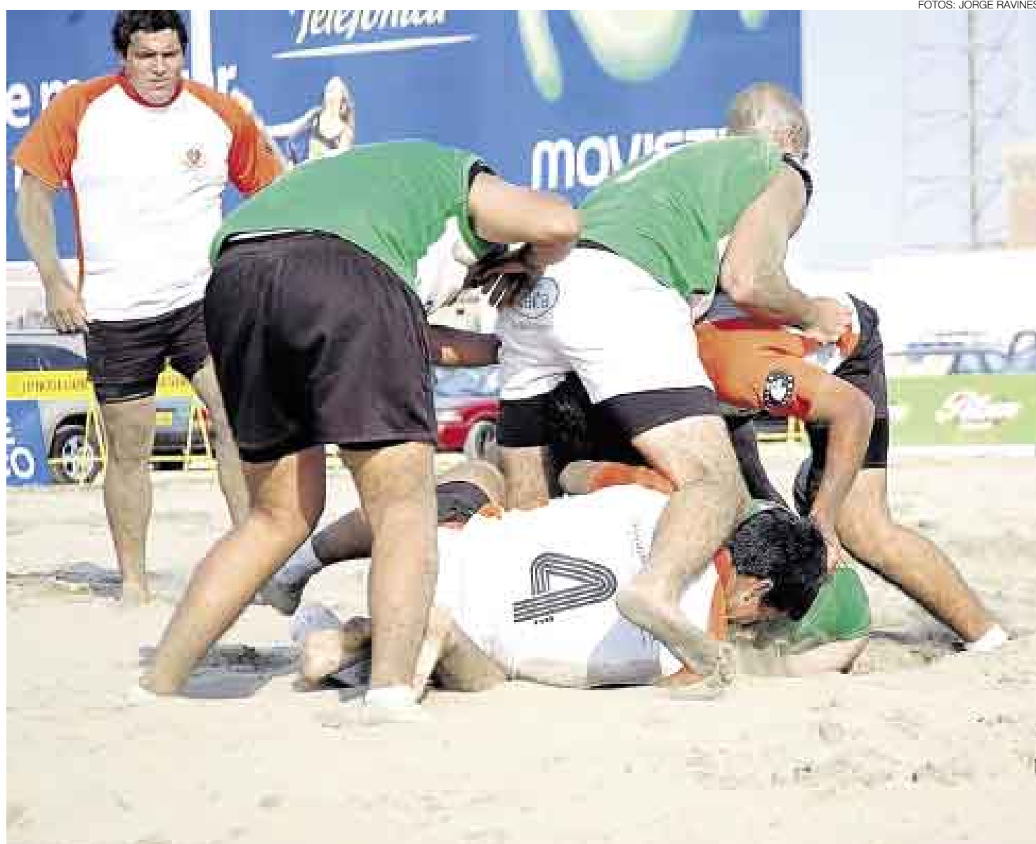
MONTAÑA HUMANA. Los Alumni (rojos) y los Flaming Lions (verdes) disputan con fiereza el balón en la cancha de arena.

Clásico rival Unas 300 personas observaron la final. Sobre las gradas de una tribuna para 150 personas, desde los estrados oficiales, al frente o desde sus autos, los hinchas disfrutaron del espectáculo.