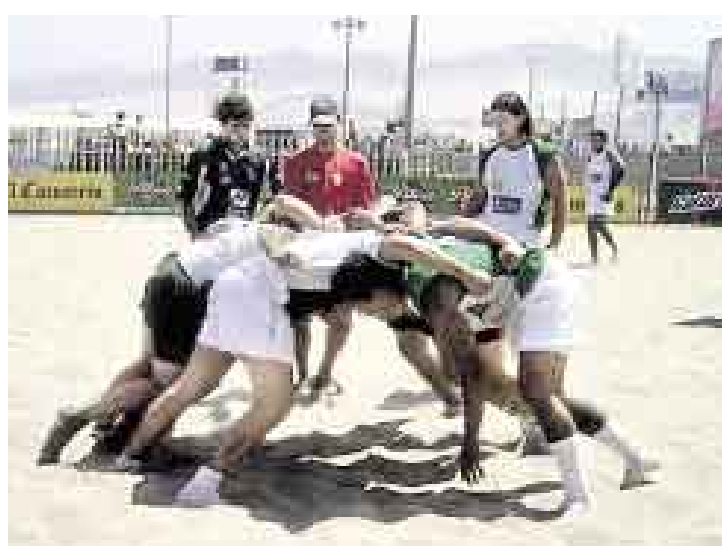
RONDA. Los equipos, integrados por siete jugadores, lo dieron todo.