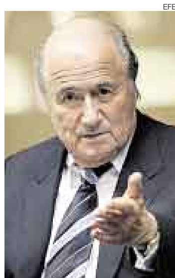
ADVERTIDOS. Como al Perú, Blatter (la FIFA) amenazó a España.

"Sería muy duro, pero yo tardaría solo seis horas en convocar, escuchar y decidir la exclusión de España en el Comité de Urgencia de la FIFA. España no podría jugar la Eurocopa ni los clubes españoles seguir en la Champions y en la UEFA", dijo Blatter en el Santiago Bernabéu, donde participó en los