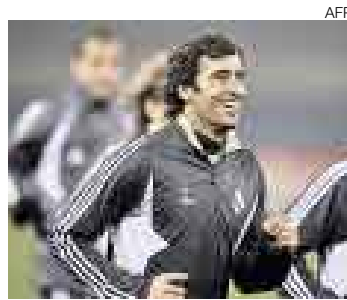
ÁNGEL. Raúl reconoció que el Real está en deuda en la Champions.

Roma [EFE]. El Real Madrid se juega hoy más que su pase a los cuartos de final de la Liga de Campeones. El cuadro español visita a la Roma en su Estadio Olímpico en busca de la gloria perdida. "Uno de los objetivos es recuperar prestigio en Europa", dijo Raúl, emblema de los blancos.