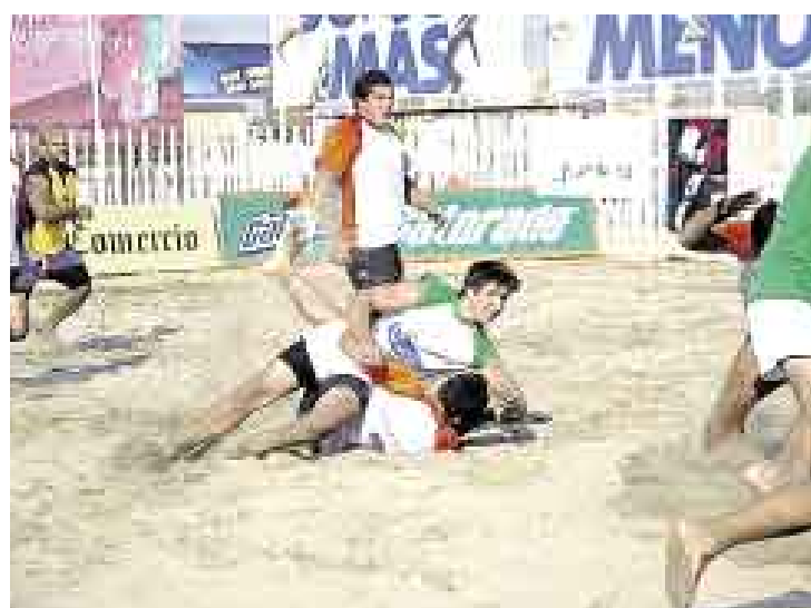
APLASTADO. Por momentos el juego no parecía tan amistoso.