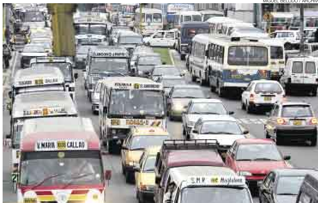
PROBLEMA PARA RATO. Posiblemente a fines del 2009 circulen los primeros ómnibus articulados por el corredor metropolitano. Sin embargo, por las otras rutas de Lima se tendrá que esperar uno o dos años más.