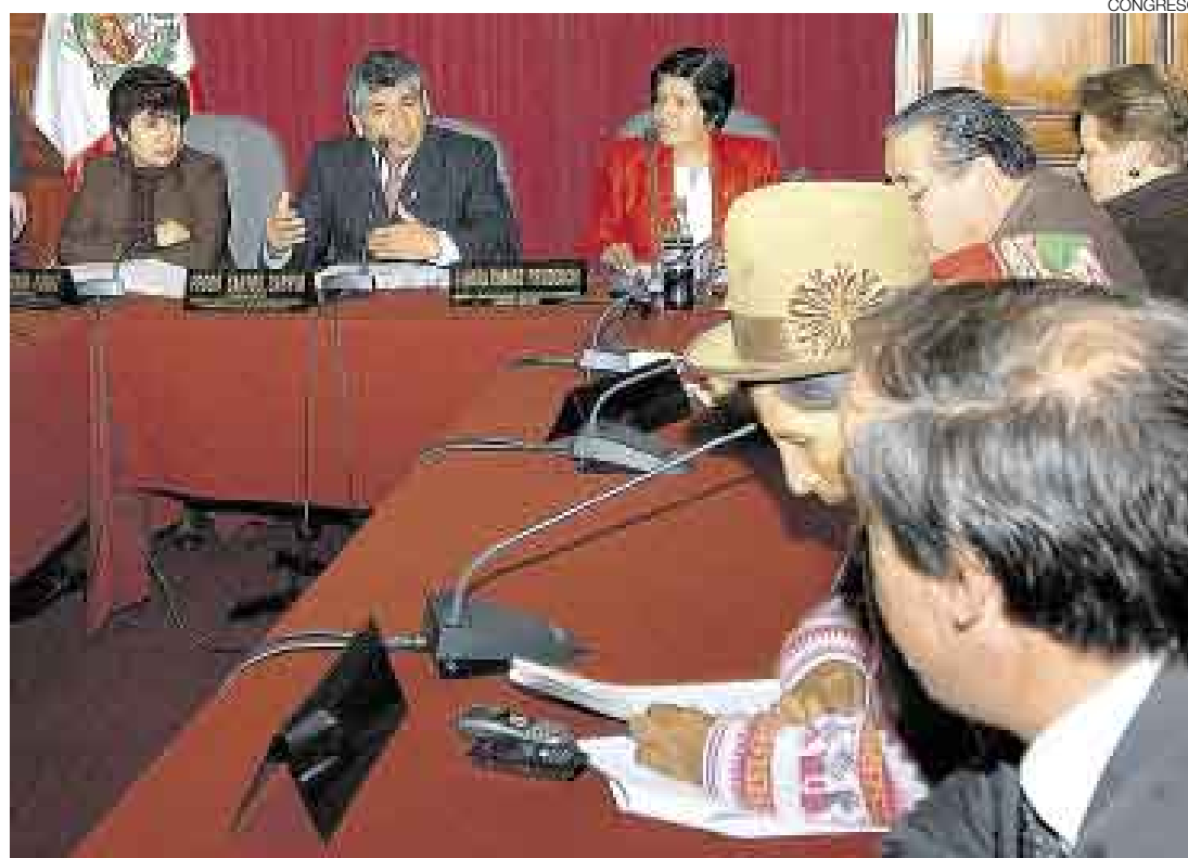
EXPECTATIVA. La Comisión de Educación del Congreso examinará hoy los alcances del decreto supremo.

La razón principal para tal sugerencia es que “vulnera el derecho fundamental de acceso a la función pública docente en condiciones de igualdad”. El informe de la defensoría, que ya está en manos del Congreso, agrega además: “Si bien tiene por finalidad mejorar la calidad docente, el DS 004 constituye una medida aislada que no se circunscribe a una política educativa integral, pues no guarda coherencia con el diseño de la política expresada en la Ley General de Educación (28044) y en la Ley 29062 (que modifica la Ley del Profesorado), así como en el Proyecto Educativo Nacional y el Plan Estratégico Multisectorial del Sector Educación 2007-2011”.