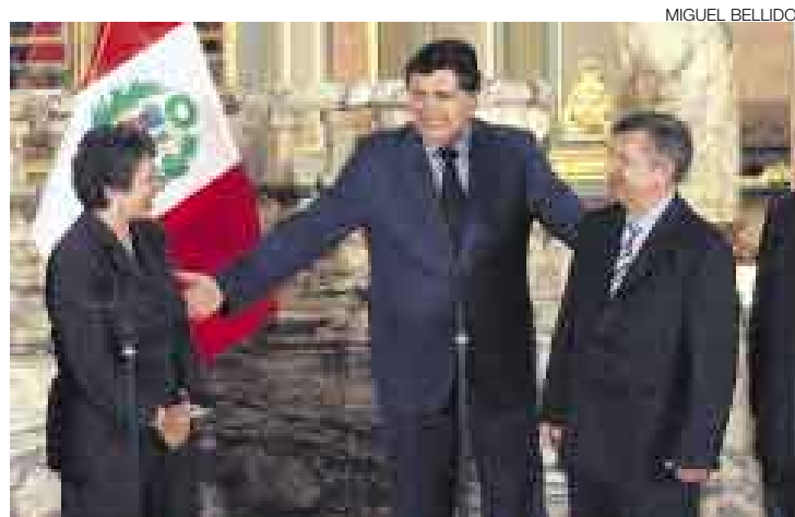
BIENVENIDOS. El presidente García recibió ayer en Palacio de Gobierno a los ministros ecuatorianos María Isabel Salvador y Wellington Sandoval.

En una declaración ofrecida en Palacio de Gobierno, el jefe del Estado recordó que ambos gabinetes se reunieron por primera vez en junio del 2007 en Tumbes. “Y dentro de poco renovaremos este cordial encuentro en la ciudad de Machala, en Ecuador, para continuar profundizando nuestra relación”, añadió García.