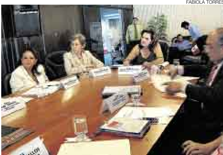
PRIMER PASO. Las autoridades se han unido contra la mendicidad infantil.

El viceministro del Interior, Danilo Guevara, anunció ayer la creación de una división dentro de la Policía Nacional que se encargará de investigar a aquellas personas que cometen el delito de trata de personas, con fines de explotación sexual, laboral u otros. Según el funcionario, la nueva división contra la trata de personas también verá el caso de los que