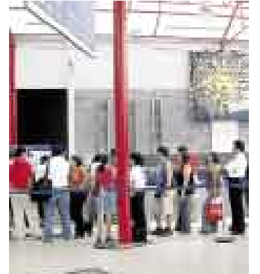
COLA. Muchos viajeros llegaron a destino tras largas horas de espera.