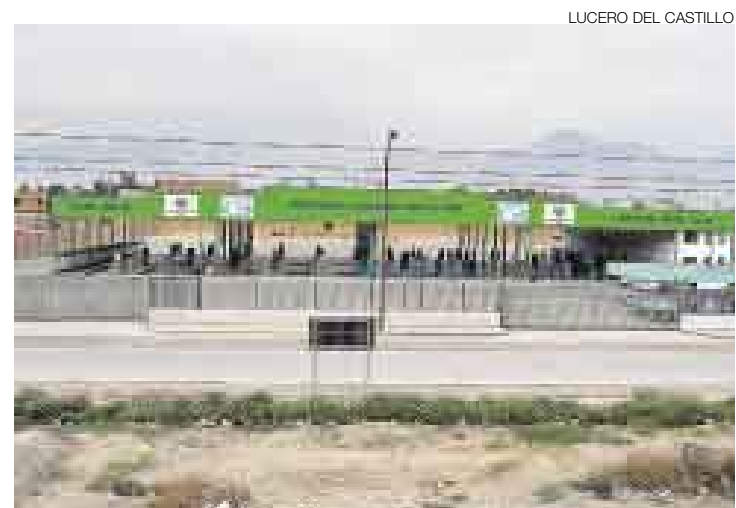
CERRADA. La planta de revisiones de San Martín de Porres, al igual que la de Villa El Salvador, amanecieron cerradas. No se observó a ningún operario.

judicado a 19 mil personas que habían pagado y que no han recibido el servicio del examen técnico. "Lamentablemente la municipalidad nos impide emitir certificados. Esto es un tema que está fuera de nuestra responsabilidad", comentó tras anunciar que su empresa se abocará ahora a defender sus intereses en los cuatro arbitrajes que sostiene con la comuna limeña y en la demanda contra el Estado que presentó la semana pasada.