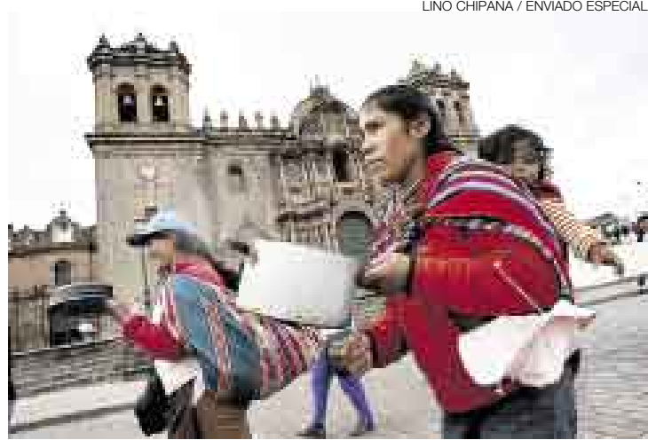
EN SUS TRECE. El Gobierno ha explicado hasta el cansancio, pero los dirigentes cusqueños no quieren entender. La población ya no los escucha.

A medida que pasan los días, en el Cusco las voces de protesta se escuchan cada vez menos. En las calles ya no se dejan oír como en los primeros días. Y es que la huelga progresiva no tuvo los resultados que esperaban los representantes de las más de 50 bases de trabajadores. Eso quedó demostrado ayer cuando en la Plaza de Armas solo veinte mujeres reclamaban, con olla en mano, la derogación de las leyes de pro-