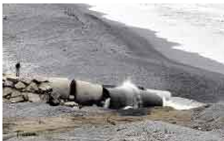
DESARMADO. Personal de Sedapal ha intentado mitigar el daño pero las obras de reparación comenzarán recién el próximo mes.

La fuerza de la marea descajó algunos de los tubos que componen el colector.